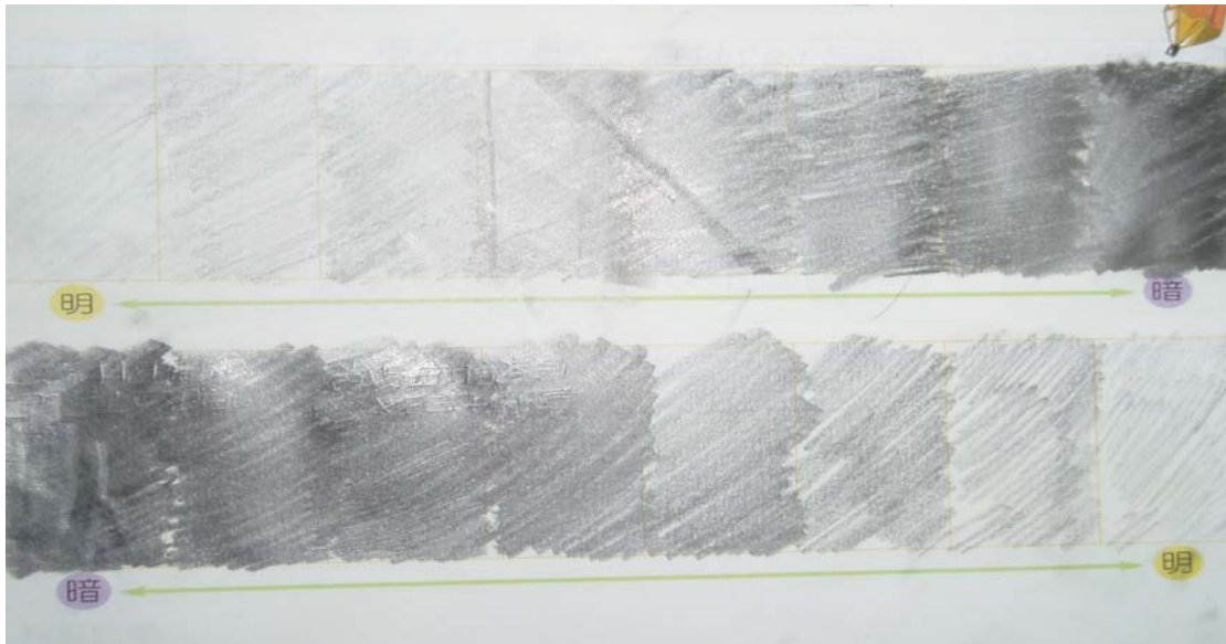
△ 素描之明暗度練習（作者：劉家偉）