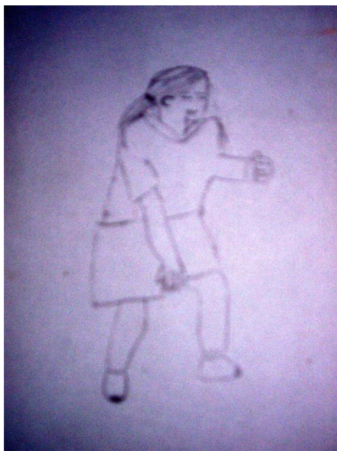
△ 動作中的人物素描 (作者：宋夢璇)