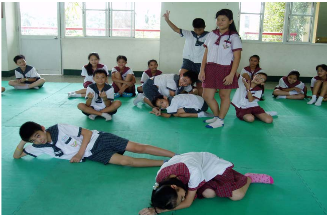
△ 最重要的班級契約—各司其職（作者：鍾煜權、賴政毅、廖月竹、陳羿帆、黃亭鈞、侯鈞嚴、林韻庭、邱婉禎）