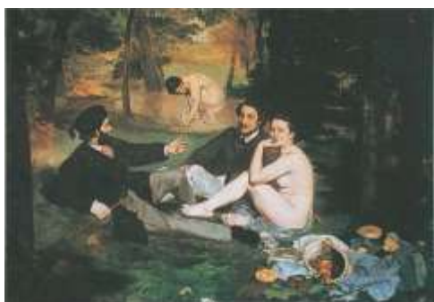
馬內 草地上的午餐