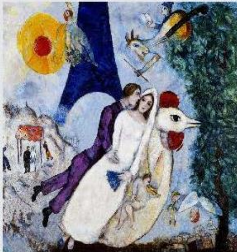
艾菲爾鐵塔的新郎與新娘 夏卡爾

小朋友說說看,你在畫中看見了什麼?找出你覺得最特別的圖像,用筆圈起來,寫寫看你認為它代表什麼意義?