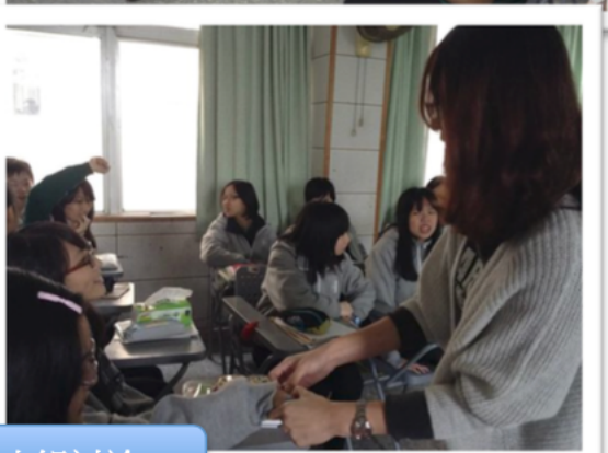
合作學習 & 小組討論