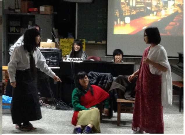
「A Well-Lighted Place」 戲劇呈現