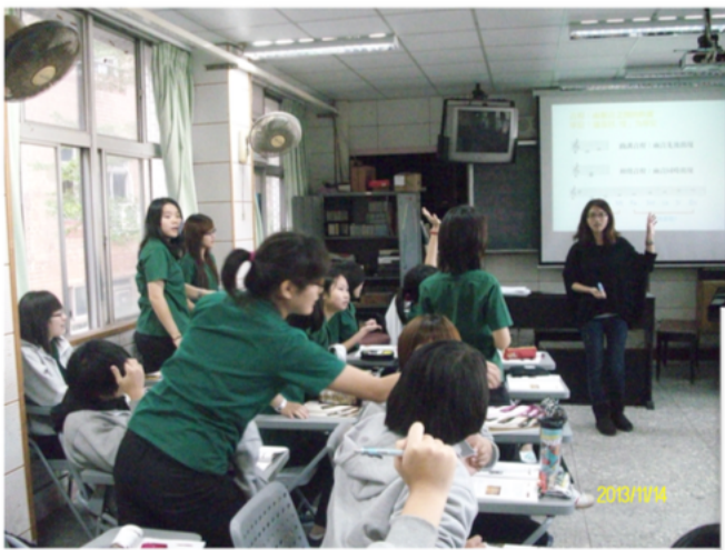
從星座認識調性關係