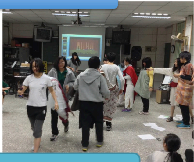
「來亂的三智者」 戲劇呈現