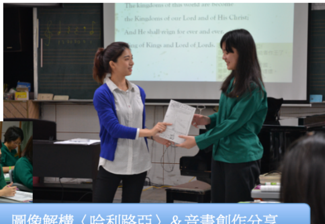
圖像解構〈哈利路亞〉& 音畫創作分享