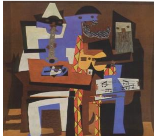
「三樂師」油彩·畫布 1921 200.7×222.9 公分