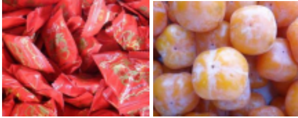
(圖)學生拍攝菜市場色彩