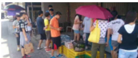
(圖)新港菜市場色彩踏查