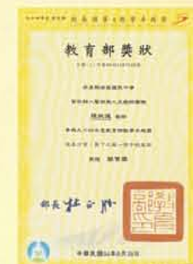
獎狀-榮獲校長領導 暨教學卓越獎銀質獎-94.9.28