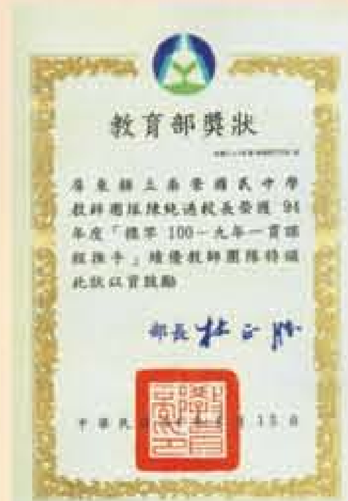
南榮國中教師團隊 榮獲94年度標竿100-9年一貫課程推手績優獎狀