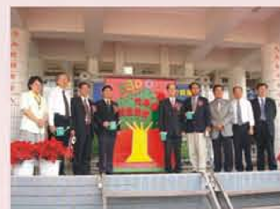
結合中央資源辦理 數位機會中心 成果展