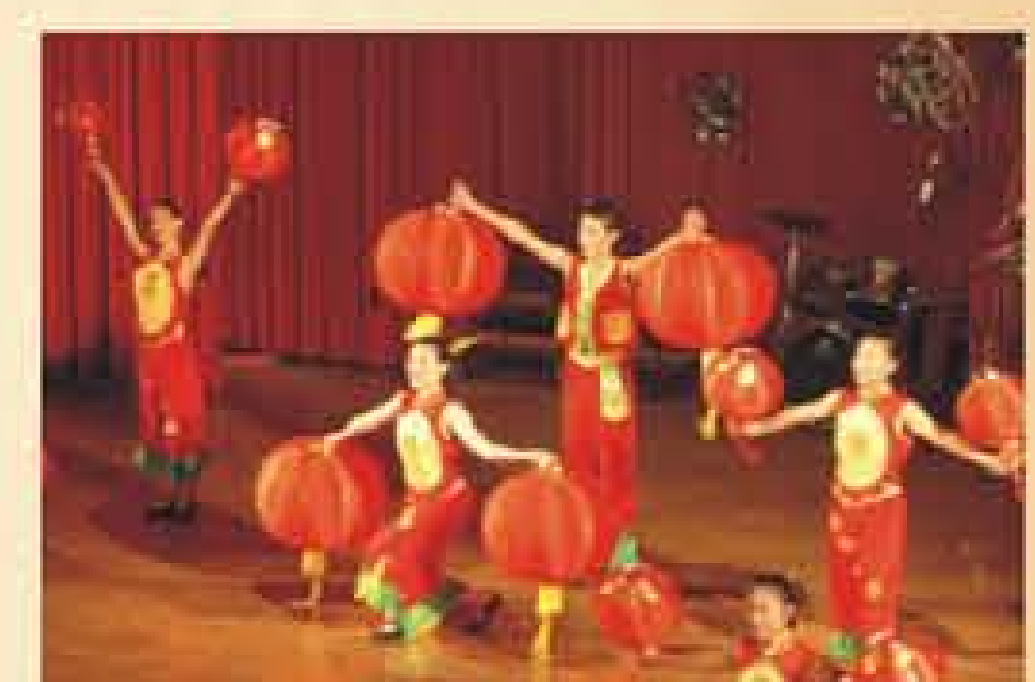
年度藝術公演：喜慶