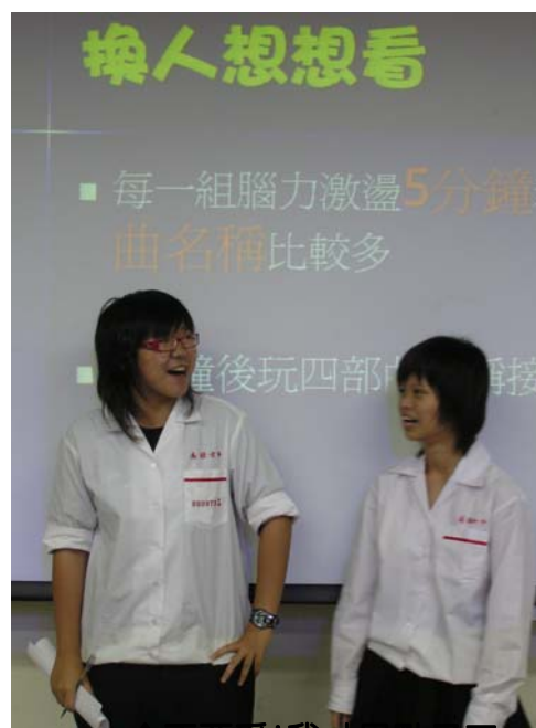
「不要爭!我才是點子王」