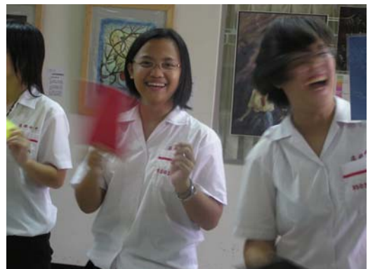
瞧！我們玩的多開心！