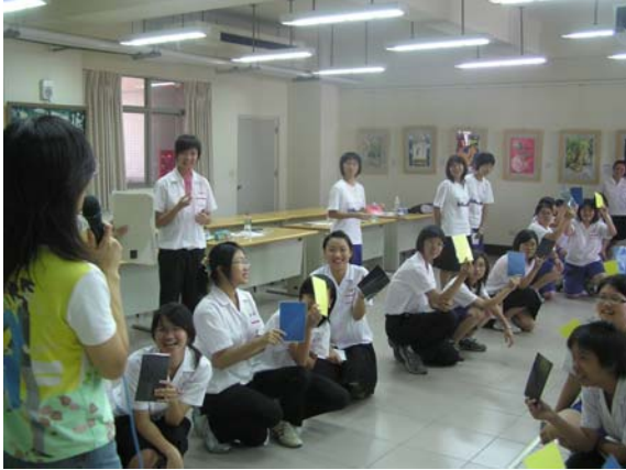
色彩原來這麼好玩！