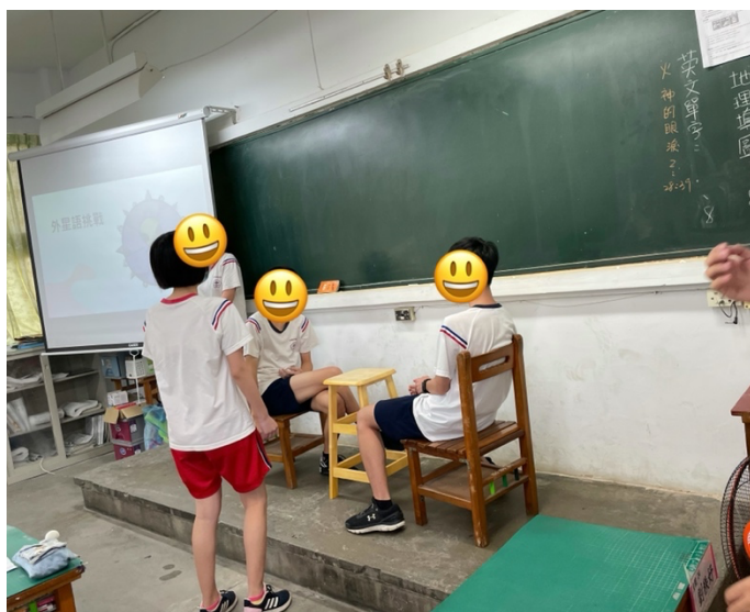
外星語挑戰－抽到地點為餐廳的組別，正在表演服務生段菜上桌的橋段。