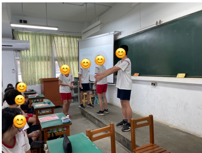
外星語挑戰－抽到地點為遊樂場的組別，正在表演遊客入園的景象。