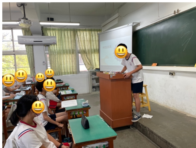
外星語挑戰－抽到地點為教室的組別，一人飾演老師，其餘組員飾演學生。