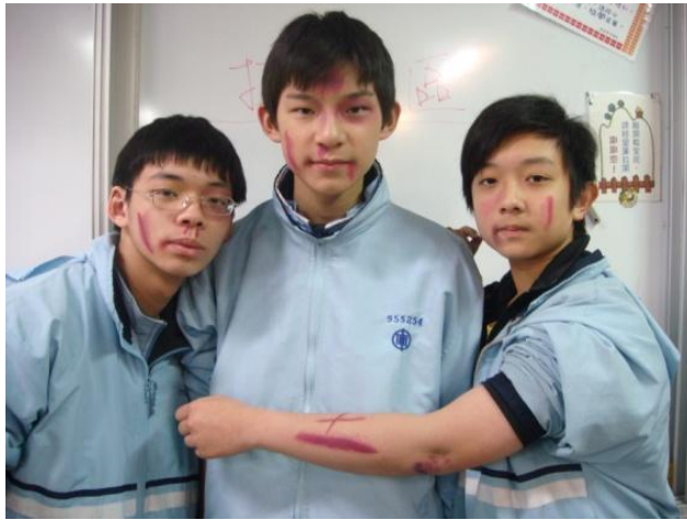
為了一隻雞腿，就被打成這樣?!