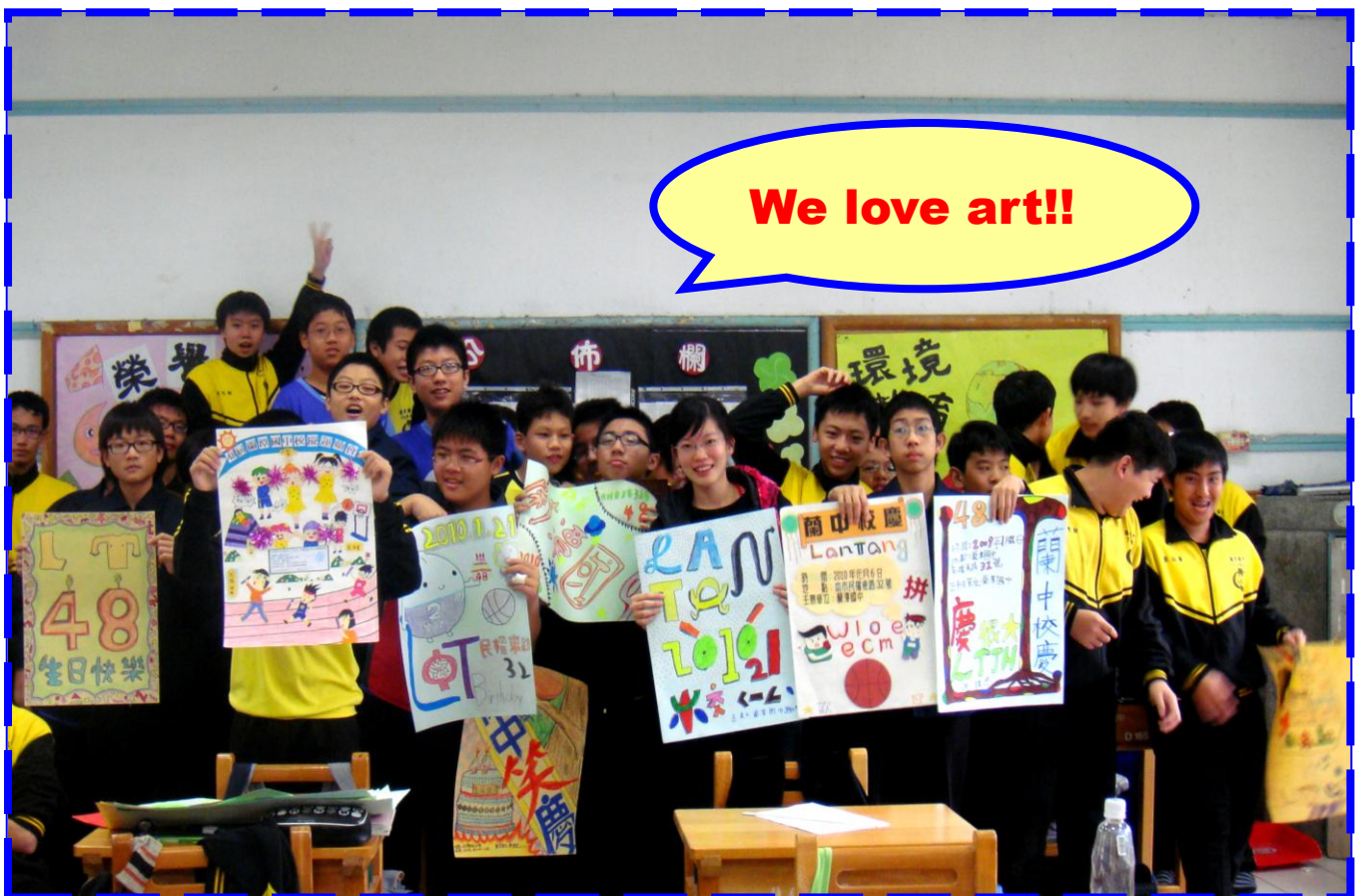
筆者與學生合影 99 年 1 月