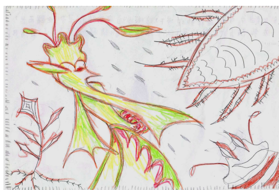
圖 3 學生聽音作畫命名—森林的樂章

學生覺得，在四季這首愉悅旋律的沉浸下，活潑的音符彷彿從中跳躍而出，在我隨意揮灑的筆下，幻化為繽紛的線條，因而命名「舞花風」。