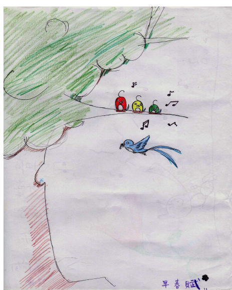
圖5 學生聽音作畫命名—曲徑通幽

學生命名的想法：活潑跳躍的曲調，使用彩度高的紅、黃、綠，來描繪出活潑的感覺，藍鳥媽媽的歸巢，說明出生的喜悅。