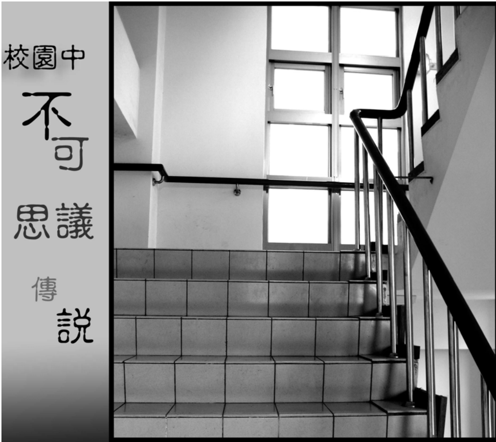
這是通往美術教室的樓梯……