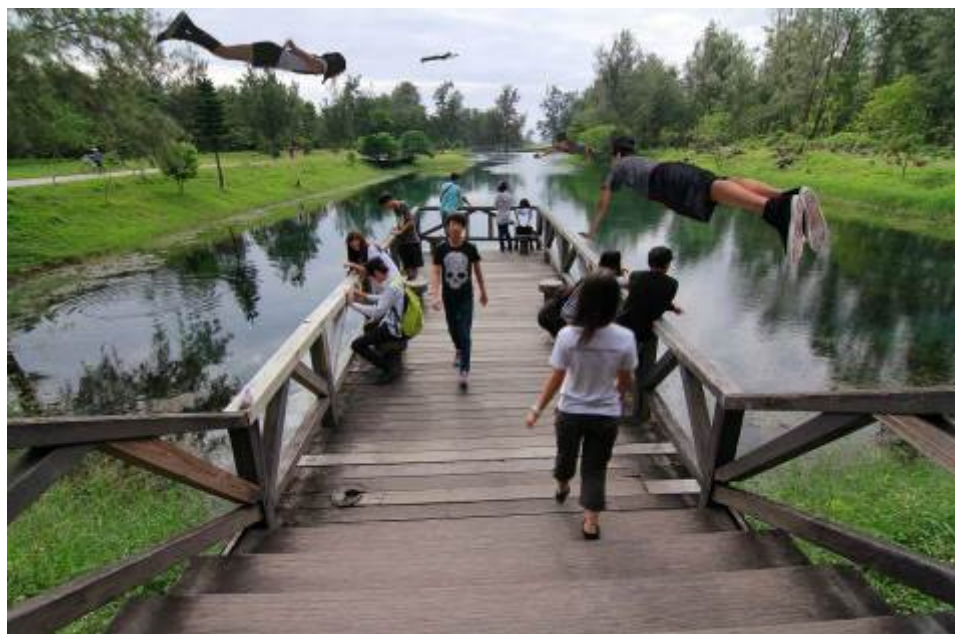
3. 未來生活飛行系列之森林公園琵琶湖