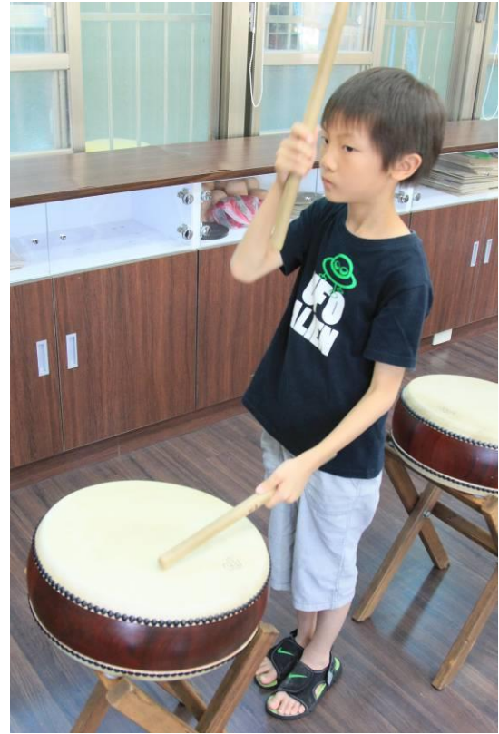
▲圖八：擊鼓後，手要舉至鼻子高度