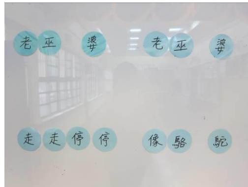
▲圖一：《老巫婆》歌詞卡