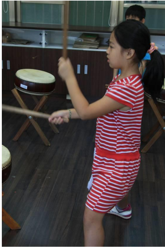
▲圖七：打擊預備姿勢