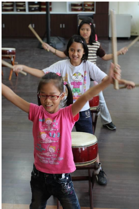
▲圖九：全音符的打法