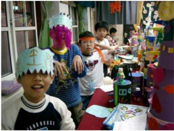
11.爲了表現與眾不同的造型！上台前，當然，我們還要打扮一番囉！