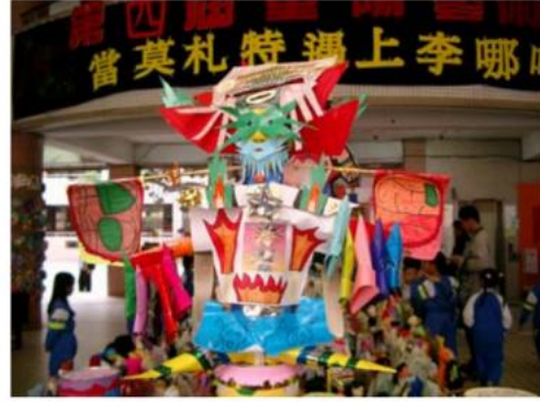
6. 看看我的造型----是不是比三太子還神氣呢！不過那不要緊，重要的是記得要來看我們的表演喔！