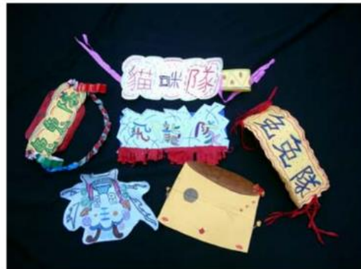
10.上台表演前，我們還設計了隊名和隊徽喔！我們是「貓咪」隊你們呢？