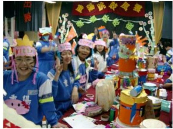
12.老師說同學們都是小小評審，哈哈那麼「最佳造型獎」，就投票給我們吧！