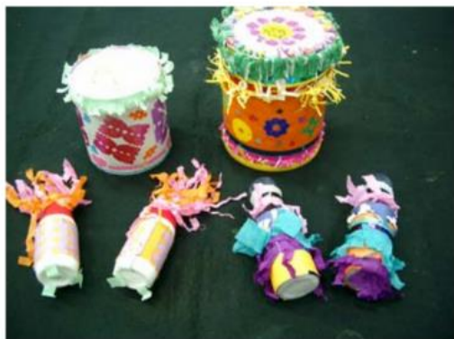
7.別急！別急！既然是跳鼓演出，-----「花鼓」製作可不能馬虎喔！結合視覺節奏的鼓與鼓槌設計，可花了我們不少時間呢！