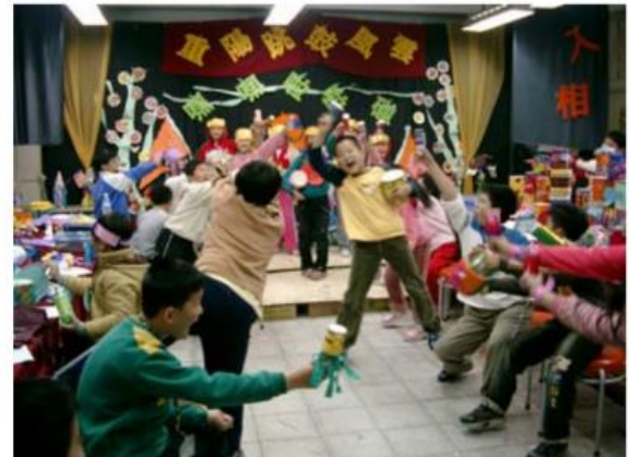
14.「輸人不輸陣」，既然「拼場」演出雖然歡迎友隊出場，但也要「噏聲」一下----「我們我們得第一，你們你跟不上」呀！