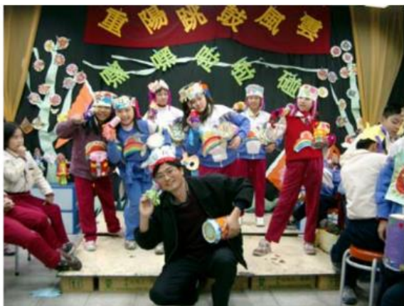
15.來！老師示範一下！？！？ 唉呀，老師您說了好多，該輪到我們表演了啦！？