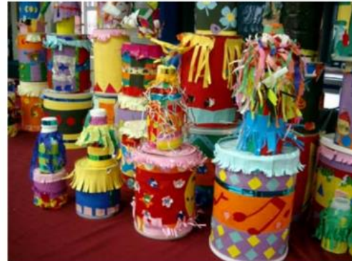
8.看看我的花鼓造型----對稱圖形與連續圖案的視覺節奏設計原理運用，配上流蘇的製作，哇！我的鼓真的好漂亮呀！