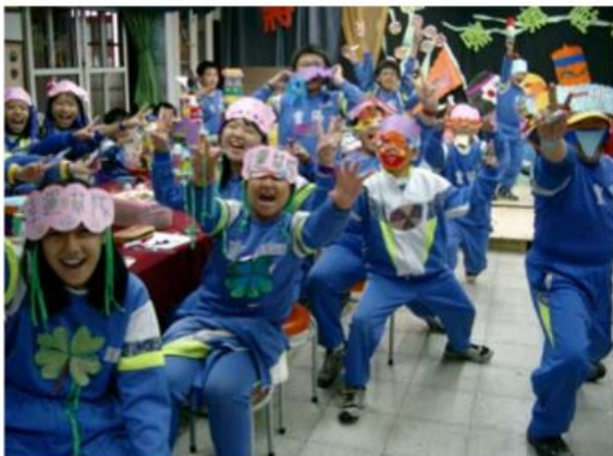
13.老師----我們都準備好了，您看看我們活力無限的樣子，「拼場」演出沒問題，「最佳演出獎」就非我們莫屬啦！