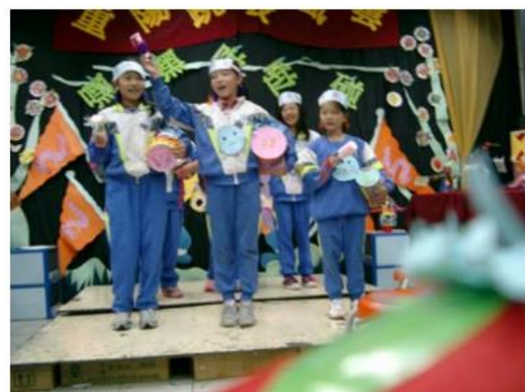
16.霹霹啪啪撲撲撲-----拐拐阿阿吃吃 ----老師說啦啦隊演出，活力最重要，但是---但是就是很緊張呀！