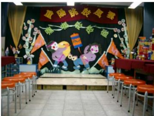
9.這就是我們演出的舞台----- 嗯！夠漂亮，我喜歡喔！