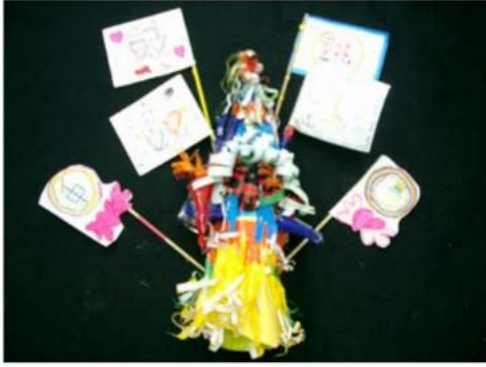
5.廣告旗面結合了京劇武將的「靠旗」裝飾而來，讓我們的廣告人物看起來更加有氣勢喔！