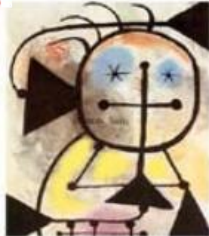
Picnic In Woods