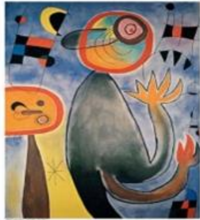
Girl in Garden Picnic In Woods