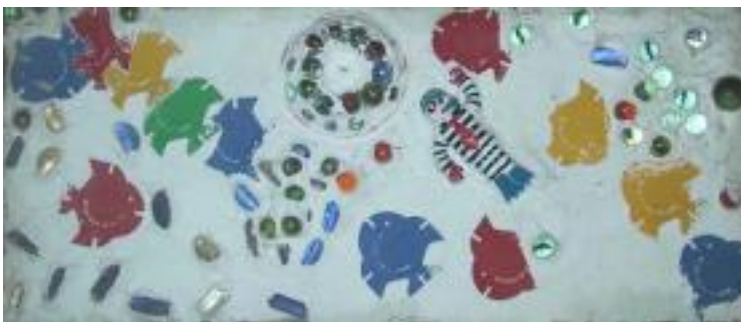
李昂儒 <不死的童年記憶-麥當勞> 麥當勞 佔據小孩的童年生活， 那是一種童年的共同記憶？ 還是一種強行輸入？