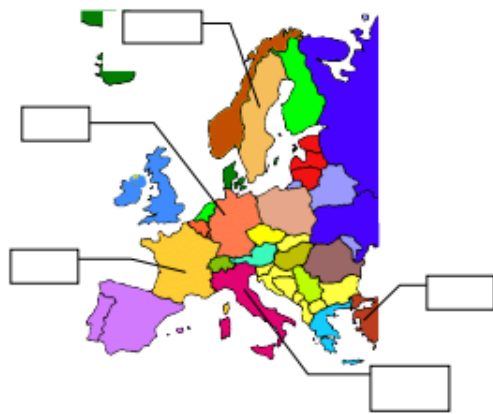
動圖 3：中世紀到羅馬的是什麼時代呢？請聰明的我們來畫一下吧！