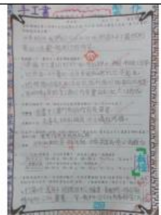
「有恆的手工書」學習單