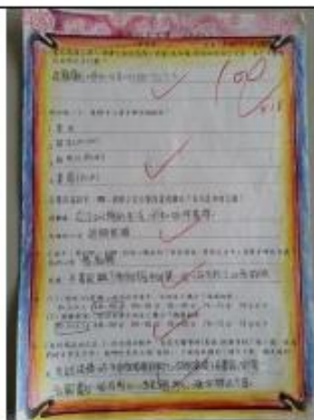
「有恆的手工書」學習單