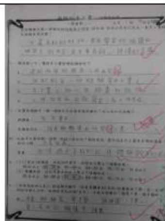
「有恆的手工書」學習單