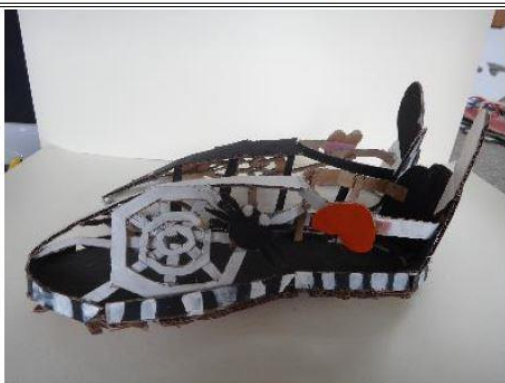
創意玩紙鞋-學生作品