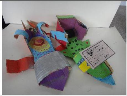
創意玩紙鞋-學生作品