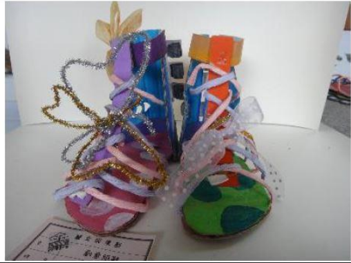
創意玩紙鞋-學生作品