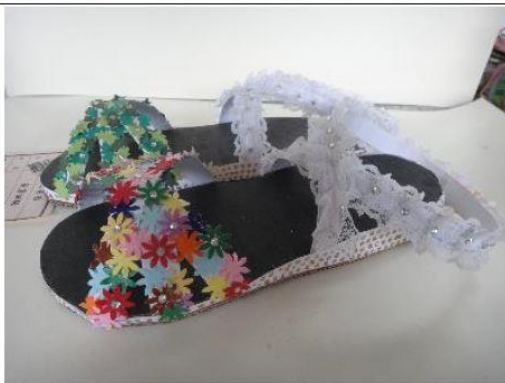
創意玩紙鞋-學生作品