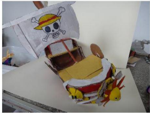
創意玩紙鞋-學生作品