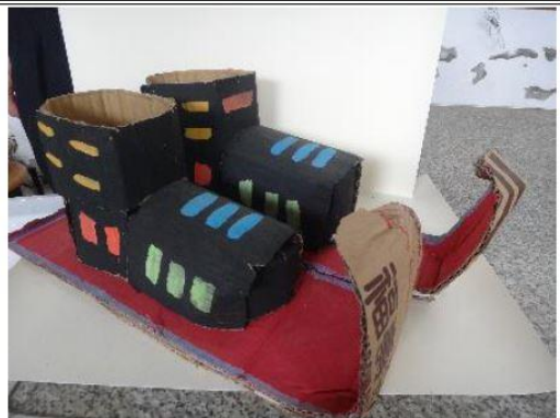
創意玩紙鞋-學生作品