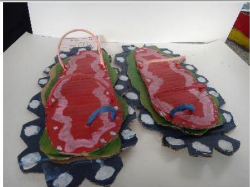
創意玩紙鞋-學生作品