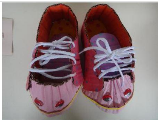
創意玩紙鞋-學生作品