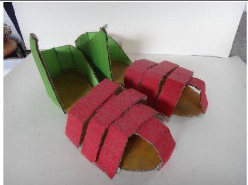
創意玩紙鞋-學生作品