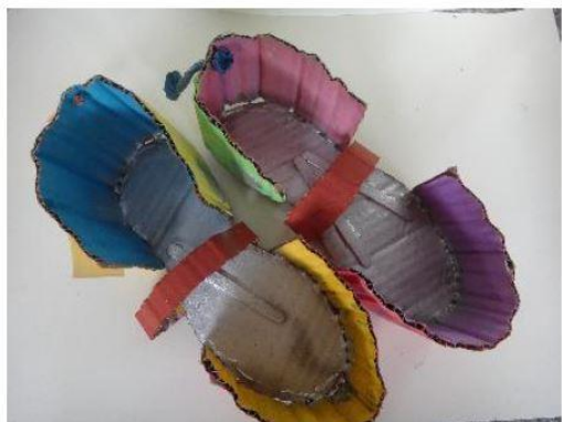
創意玩紙鞋-學生作品