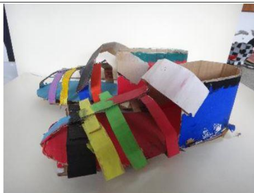
創意玩紙鞋-學生作品