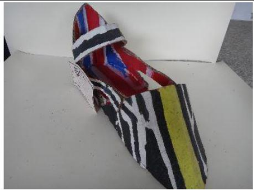
創意玩紙鞋-學生作品