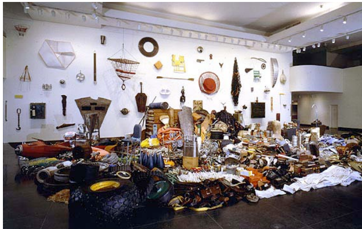
圖 3-3 Donald Lipski, 1998, Pieces of String too Short to Save. Brooklyn Museum