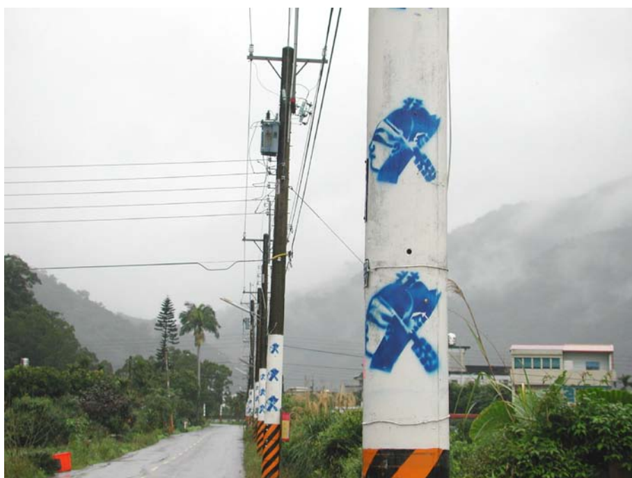
圖 1-2 枕山村電線桿上的地標：歌仔戲頭像