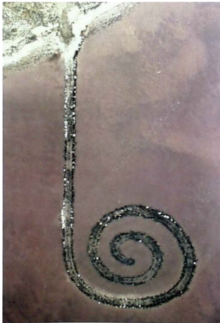
圖 2-1 Robert Smithson 1970 螺懸形防波堤 猶他州大鹽湖