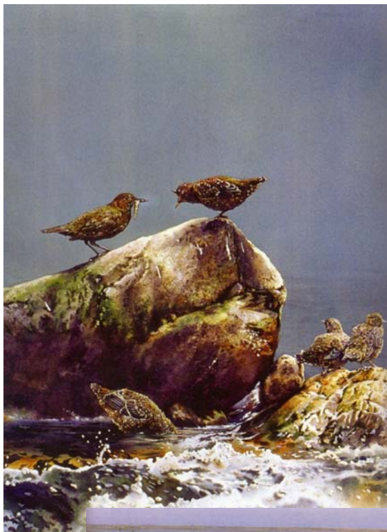
圖 3-1 楊恩生 河鳥（局部）1991 水彩。畫紙 150×100 公分 私人收藏