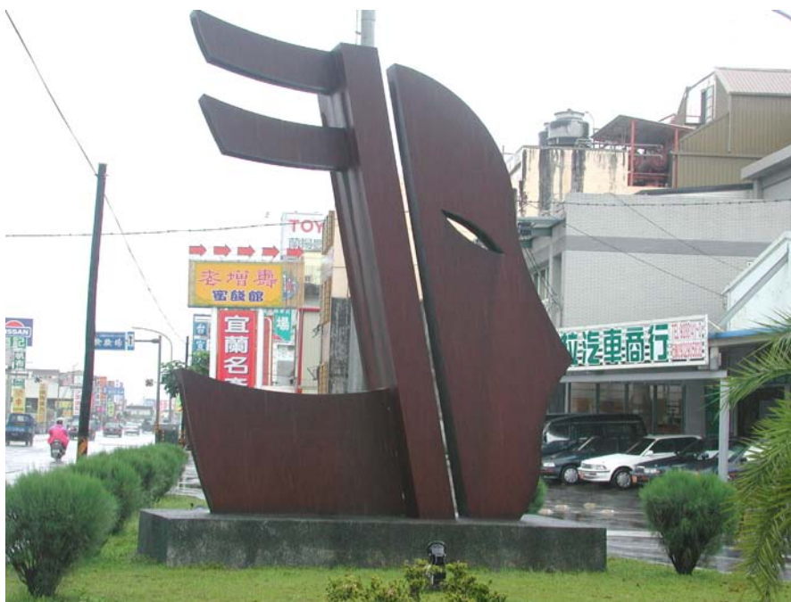
圖 1-1 宜蘭的地標：歌仔戲頭像