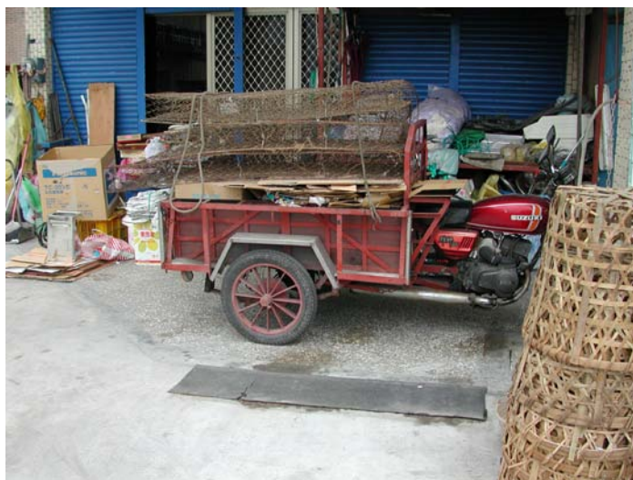
圖 3-4 筆者 2003 拾荒者 宜蘭縣