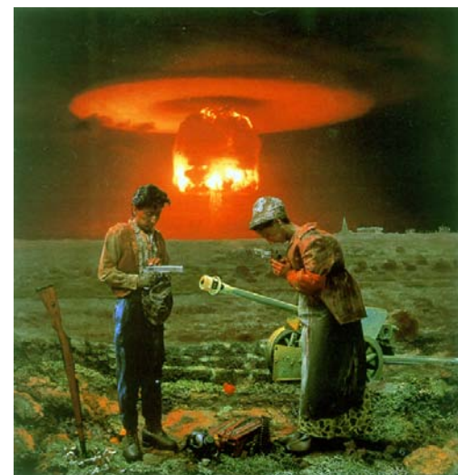
森村泰昌 <Brothers (Late Autumn Prayer)> 1991