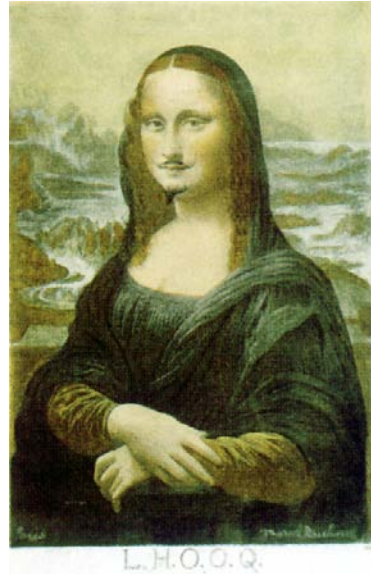
馬賽爾・杜象 (Marcel Duchamp), 《現成物.H.O.O.Q.》, 1919