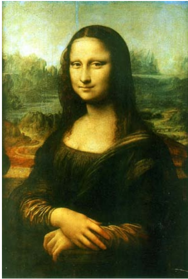
達文西 蒙娜麗莎 Mona Lisa 1502-05 畫板・油彩 77 x53cm 巴黎羅浮宮