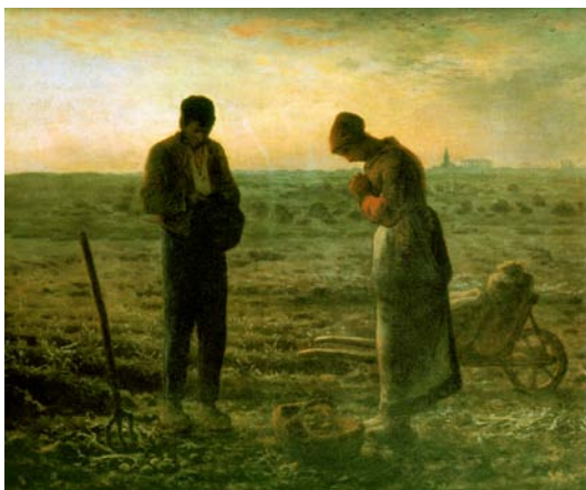
米勒 晚禱 The Angeius 1857-59 55.5 x66cm 畫布·油彩 巴黎奧塞美術館