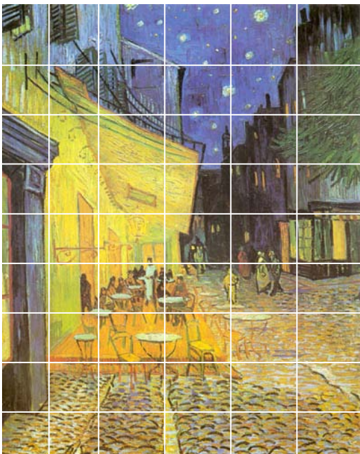
梵谷 夜晚露天咖啡座（1888，耶魯大學畫廊）