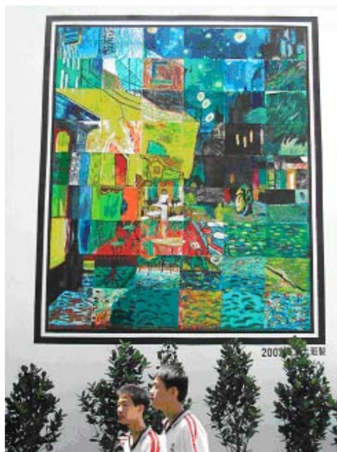
高二忠班仿製（2002，精誠中學尚志樓牆）