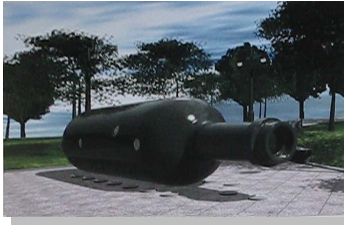
Malcolm Cochran之公共藝術品「紐約瓶中船」