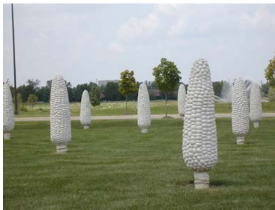
Malcolm Cochran之公共藝術品「玉米田」