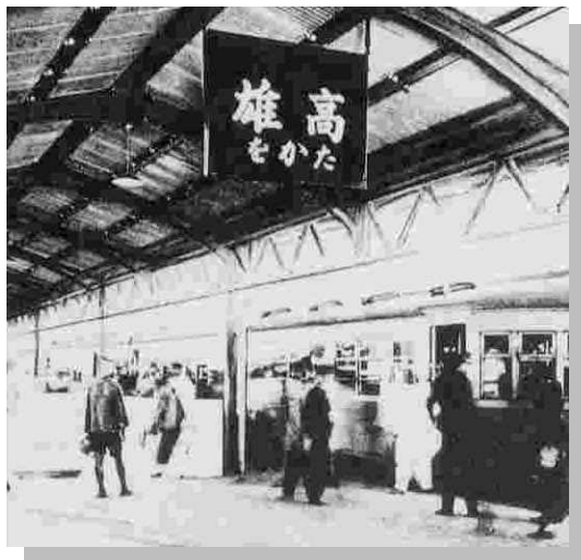
舊時高雄火車站搭車景象 (網路圖片)

高雄火車站自建成後的六十二年，歷經 14 位站長，千萬的乘客，還有二次世界大戰、二二八事件、美麗島事件…等台灣歷史上重大的歷史事件，所以高雄火車站在交通運輸之外，更深層地還記載著高雄這個城市的歷史，故高雄火車站和其鐵道文化可以為高雄人對高雄這個社區建立認同的重要出發點。