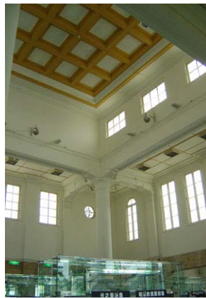
高雄舊火車站內部