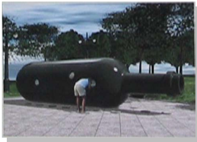
Malcolm Cochran之公共藝術品「紐約瓶中船」