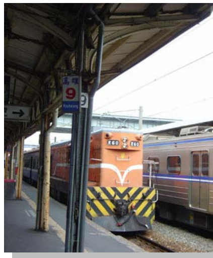
現今高雄火車站月台

由於高雄捷運、高鐵的建立，原高雄火車站的位置將是台鐵、捷運、高鐵「三鐵共構」的中心，原本要面臨拆除的高雄火車站，在高雄人極力維護和聲援下，展開「保存火車站」的運動，即以工程上的「總掘工法」進行遷移，也就是在完全不損壞地面上建物的方式，將整棟建物移至附近的空地安放，同時也在站旁建立「高雄願景館」(以介紹高雄鐵道文化為主)，以及週遭附屬的高空鳥瞰區，讓高雄人民一同參與見證火車站的保存與改變。