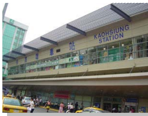
人來人往的高雄臨時火車站