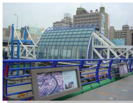
保存鐵道文化的高雄願景橋