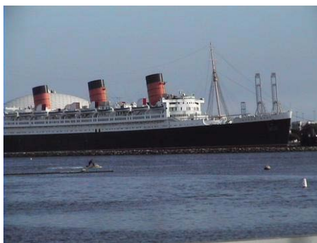
瑪莉皇后二號