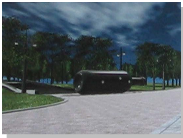
Malcolm Cochran之公共藝術品「紐約瓶中船」