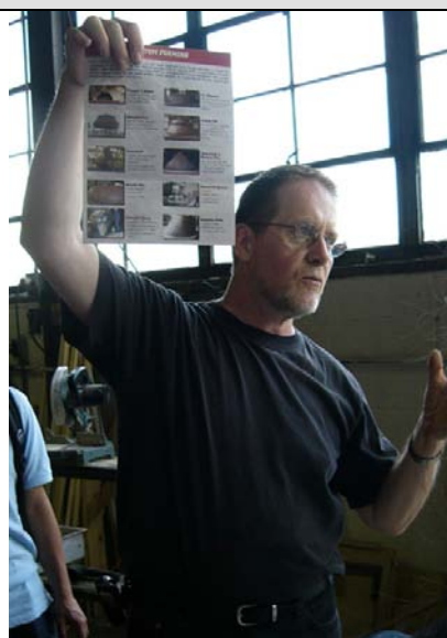
藝術家Malcolm Cochran (傅斌暉攝)

Malcolm Cochran，1948年出生，現為美國俄亥俄州州立大學藝術教育研究所的教授，也是美國新銳的藝術家，專長是創作以社區認同和社會反思為議題的雕刻、裝置藝術品、以及公共藝術品，其中最為熟知的作品，為現今置放於美國俄亥俄州都柏林市的公共藝術作品「玉米田」(Field of Corn)。該作品主要是呈現都柏林市過去依賴玉米種植為生的歷史，希望現在的都柏林市民可以透過藝術品，瞭解玉米和社區生活的關係，緬懷並延續過去社區的生存精神。