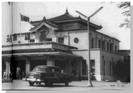
帝冠式建築的高雄火車站

高雄火車站是日據時代末期，也就是 1941 年由日人所建，落成後的高雄火車站不但是南部的交通要口，肩負交通運輸的重任，同時車站本身「興亞帝冠式」的雄偉建築，和極富時代特色的西方古典式內部構造，結合站前的廣場，使它成為高雄市的中心地標，以及精神象徵。