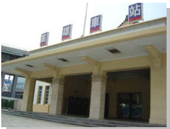
高雄舊火車站

請學生到高雄舊火車站遺跡參觀，請學生仔細觀察舊火車站，以及火車站周遭環境，並拍攝照片予以記錄，以做為創作時的參考資料。