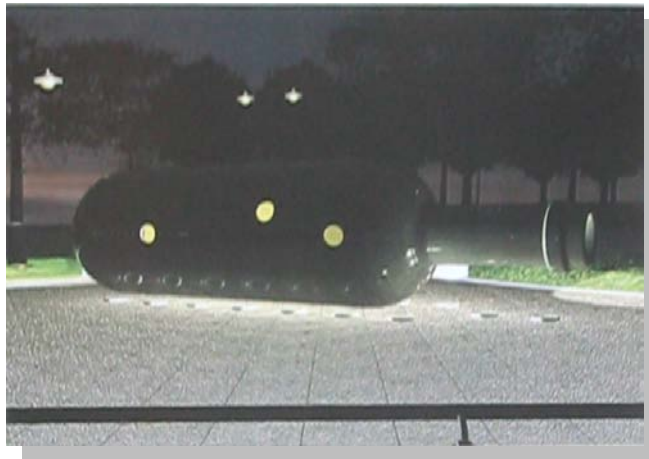
Malcolm Cochran之公共藝術品「紐約瓶中船」