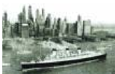
哈德遜河岸碼頭