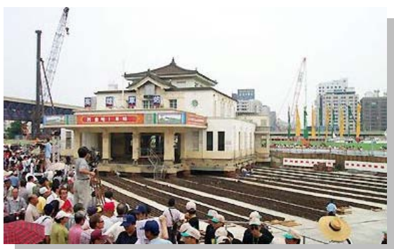
高雄火車站的搬遷工程

由於高雄捷運、高鐵的建立，原高雄火車站的位置將是台鐵、捷運、高鐵「三鐵共構」的中心，原本要面臨拆除的高雄火車站，在高雄人極力維護和聲援下，展開「保存火車站」的運動，即以工程上的「總掘工法」進行遷移，也就是在完全不損壞地面上建物的方式，將整棟建物移至附近的空地安放，同時也在站旁建立「高雄願景館」(以介紹高雄鐵道文化為主)，以及週遭附屬的高空鳥瞰區，讓高雄人民一同參與見證火車站的保存與改變。