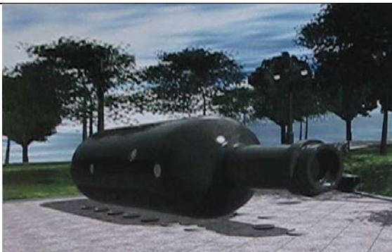
Malcolm Cochran之公共藝術品「紐約的回憶」

紐約曼哈頓島哈德遜河各個碼頭是1940-50年代，歐洲人移民美國的重要登陸地點，雖然現在已經淤積而漸漸減少其交通重要性，但是它對紐約的交通歷史和文化，以及對紐約人的意義和重要性，是有著無可取代的地位，也是紐約人建立其社區認同的一個重點。