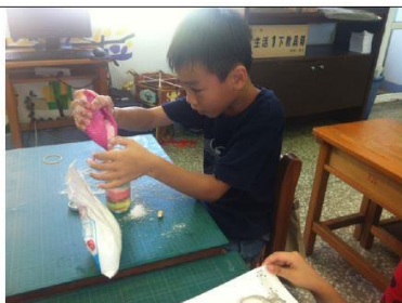
說明：年紀小的學生要注意小心倒鹽