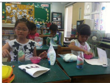
說明：學生製作彩色鹽過程