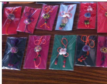
說明：貝殼花結合中國結商品(學生作品)