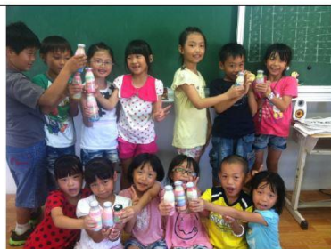
說明：彩色鹽罐完成品(風櫃國小一年級)