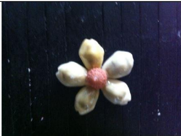
說明：金環寶螺製作成貝殼花示範