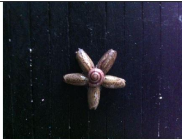
說明：匪螺製作成貝殼花示範