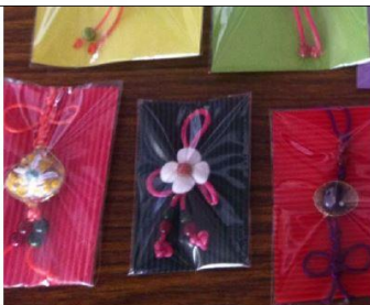
說明：貝殼花結合中國結商品(學生作品)