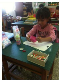
說明：學生製作彩色鹽過程