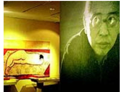
國立歷史博物館舉行常玉紀念展 2001.10.13~2001.12.02

經由教師將整理妥的常玉生平資料以故事講述的方式，佐以相關的圖片，讓學生瞭解常玉旅居日本、法國漂泊的一生，並闡述其生活、治世態度，讓學生揣摩如此豁達的生命，讓這位藝術家以會以何種的樣式或風格來呈現其作品？