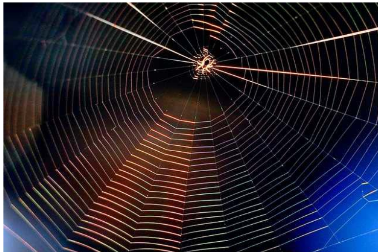
圖 1 - 3 世界上最具韌度的絲線 - 蜘蛛絲