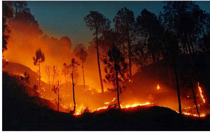
圖 4-2 森林大火是自然界的一種循環現象