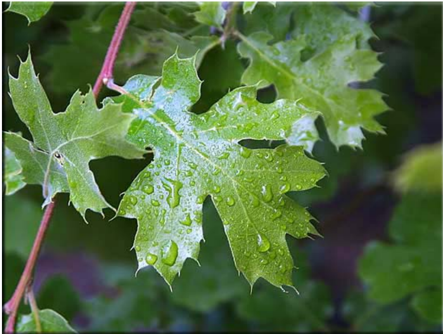
圖 4-3 雨水順著葉脈排出去