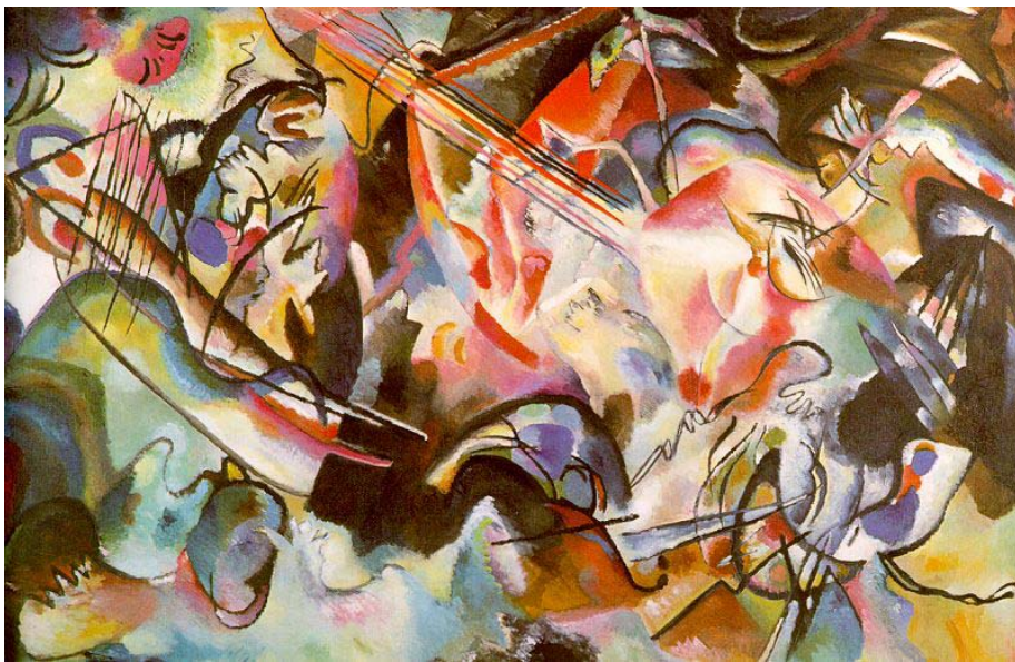
圖 4-4 康丁斯基 (Kandinsky) 作曲 1913 油彩