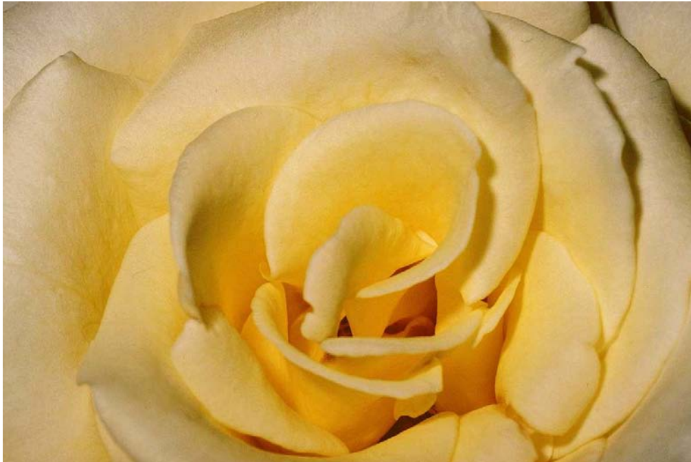
圖 1 - 1 花瓣的螺旋排列是一種黃金比例