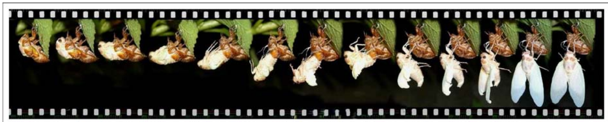
圖 4-1 令人驚豔的時刻 — 蛻變