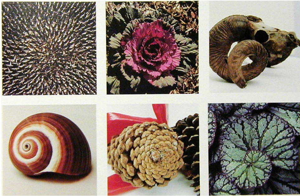
圖 1 - 2 大自然中各種黃金比例螺旋曲線的美