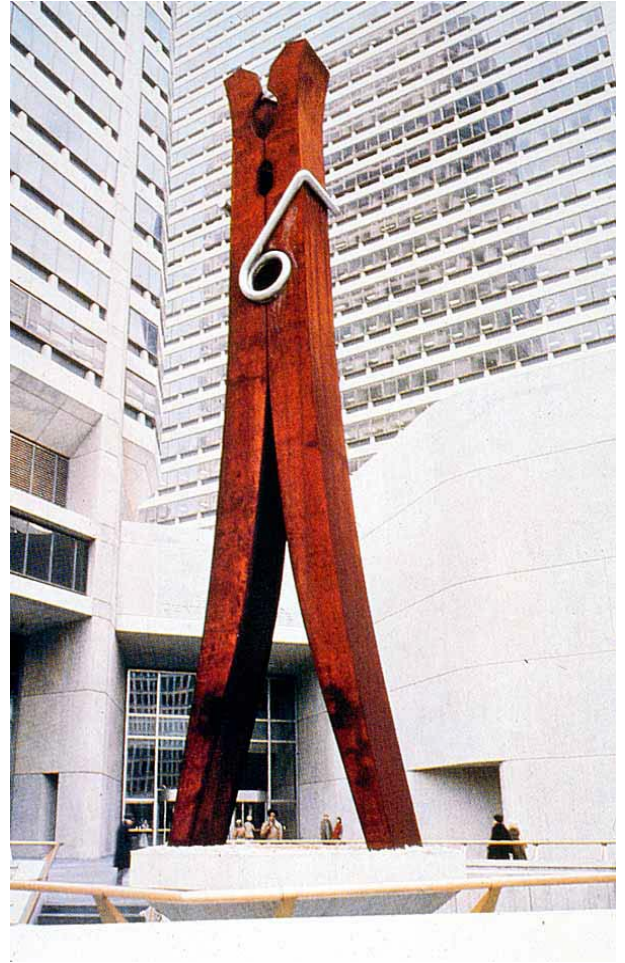
圖 3-2 林書民「非