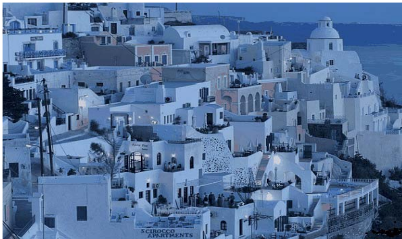
圖 2-2 希臘小島上的城市以藍色配白色作為它的基礎色調