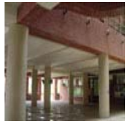
陶亞倫「Take a Break」