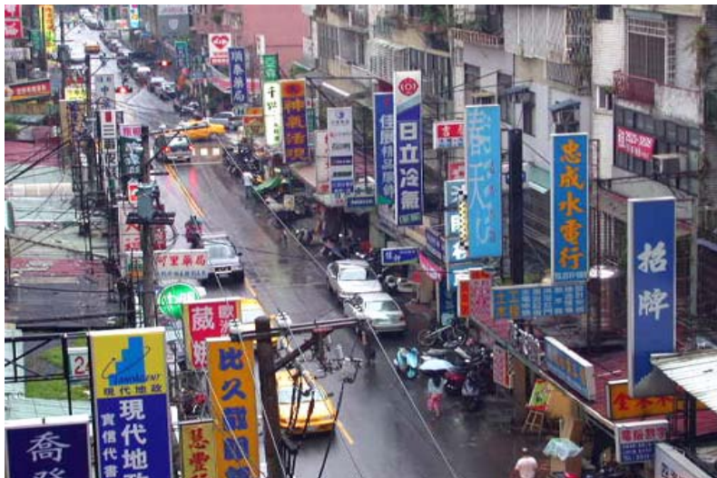
圖 2-3 台灣的都市充滿了五顏六色