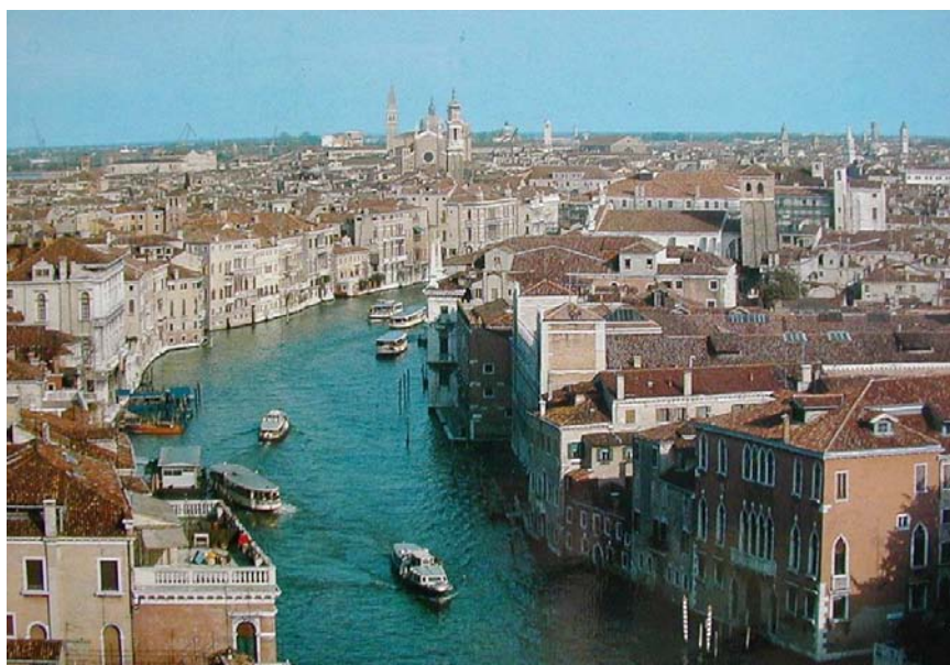
圖 2-1 威尼斯整個城市以棕色配白色做為它的基礎色調