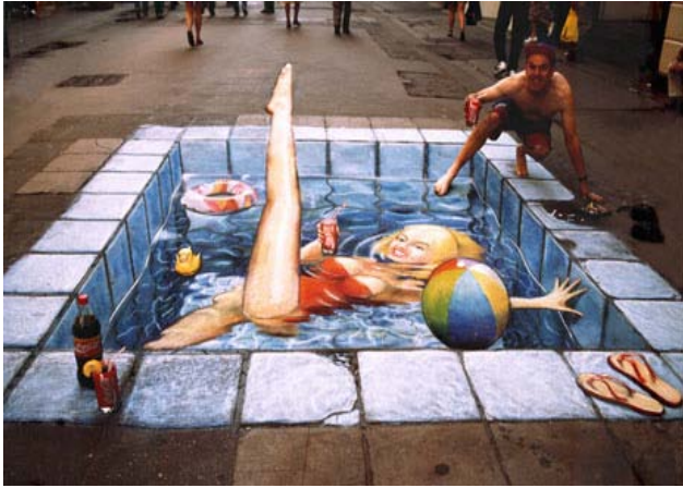
圖 3-1 街頭圖鴉