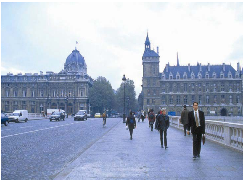
圖 2-4 巴黎的道路規劃井然有序