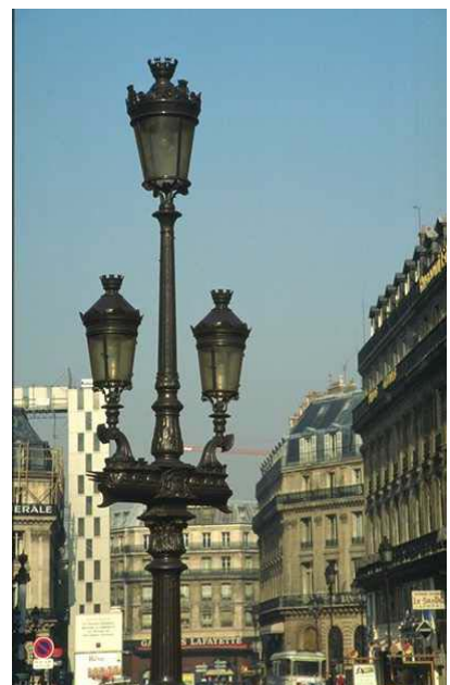
圖 2-5 巴黎的城市家具