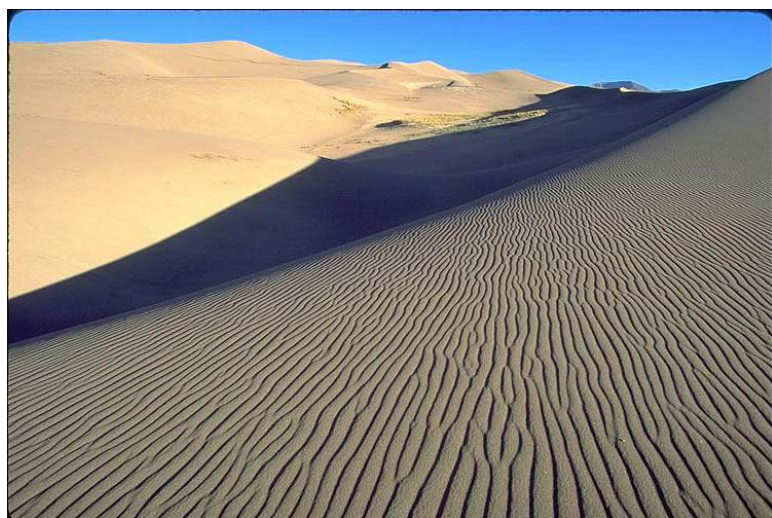
圖 1 - 4 風與沙的舞蹈