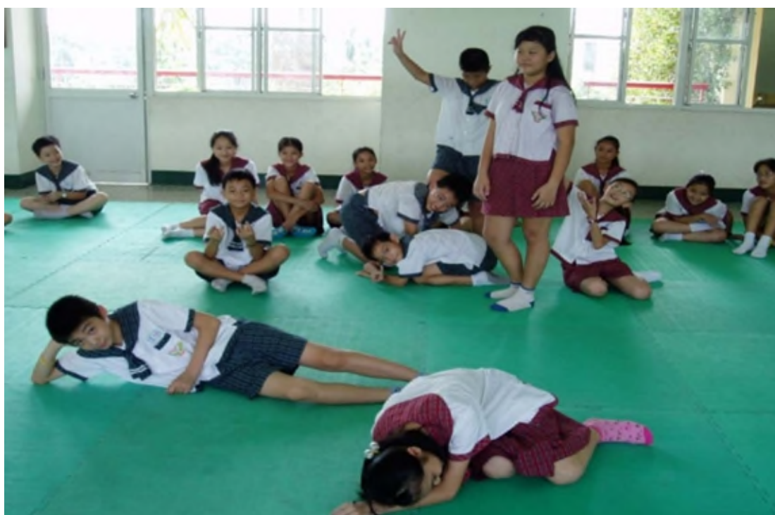
△最重要的班級契約—各司其職（作者：鍾煜權、賴政毅、廖月竹、陳羿帆、黃亭鈞、侯鈞嚴、林韻庭、邱婉禎）