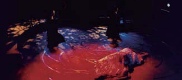
圖2 同於圖1的場景，不同的燈光設計產生不一樣的視覺效果。