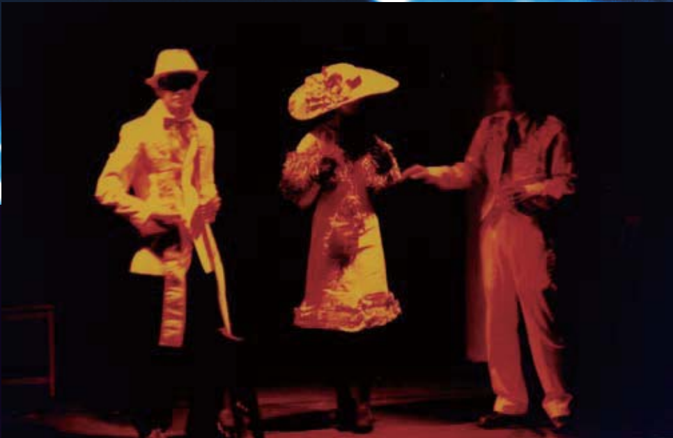
圖3 服裝造型說明劇中角色。

對這些難題和障礙，如何變通，同時又如何解決才適宜呢？當然，若要完整的探索和回答以上這些問題，自然又是另一個大課題了，而在此之所以提出這些種種，是提醒身為劇場觀眾的你我，在看戲的同時，不只是看「戲」而已，可不可能進一步看到它究竟是如何成形，而後能夠更加理性客觀的討論？