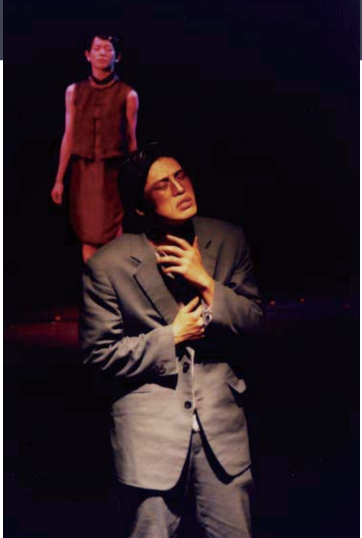
圖4 導演利用舞台畫面構圖說明角色關係。

至於音樂在劇場裡通常分為情境音樂（營造氣氛）和聲音效果（如雷雨聲、電話鈴聲、街市噪音...等）兩種。適當的背景音樂可以為氣氛營造加分，而且有別於布景、燈光等視覺呈現，音樂的深植人心、動人心弦之效，往往是不可言喻的。音樂的取得可由已出版的錄音帶、CD、甚至老唱片中轉錄得到。近幾年劇場演出逐漸跨界邀約樂曲創作者共同參與製作，也不失為值得積極鼓勵的專業分工方式。至於聲響效果部分，有時是在錄音室轉拷預錄音效帶在演出時播放，也可以在演出時由舞台左右或後方，請工作人員配合執行，如電鈴聲、電話聲、鼓聲、敲門聲等更具現場感的效果處理。