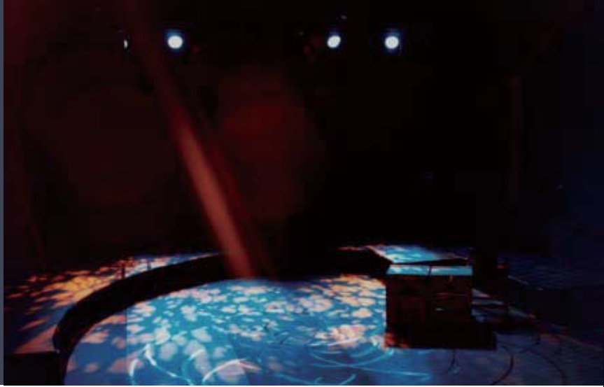
圖 1 劇場演出利用燈光創造場景氣氛。

你是一個會進劇場看戲的觀眾嗎？是因為你的學習背景需要如此，是親朋好友的請託捧場，或是純粹因為喜愛舞台戲劇？每當你看戲時，第一件會吸引你注意力的事情是什麼，最在意的事情又是什麼？而在每回看完戲離開劇場之後，你的心裡和腦海裡會想著的、會留存下來的又是些什麼？