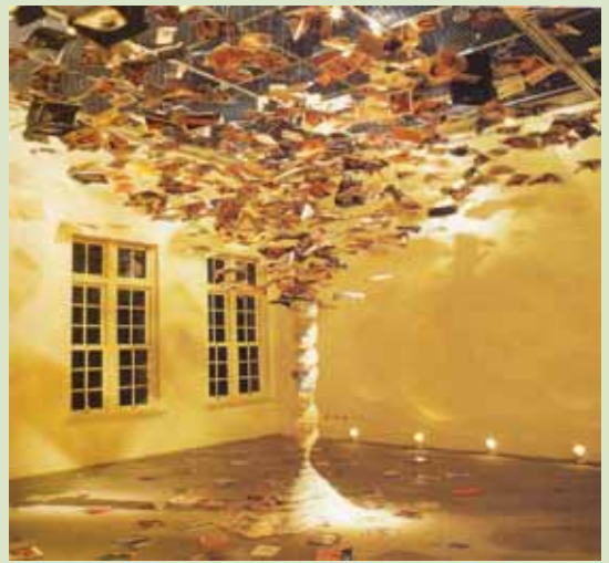
圖1 陳龍斌 資訊風暴 2001（引自孫立銓《裝置與空間藝術》，81。）