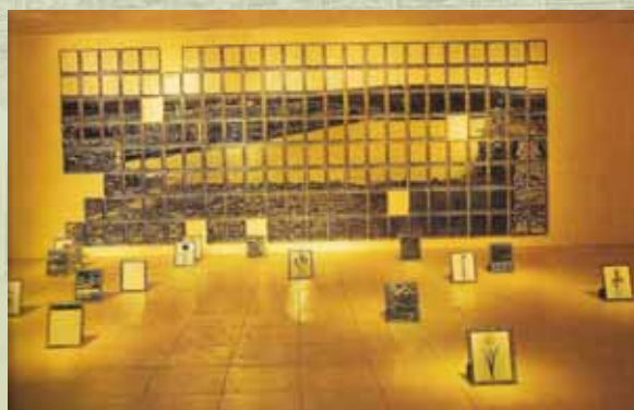
圖5 陳順築 風中的記憶：田地 1998 (引自孫立銓《裝置與空間藝術》，107。)

品多屬輕鬆幽默，頗符合後工業社會的商品消費品味。這是與抽象表現主義繪畫最大的差異處吧。