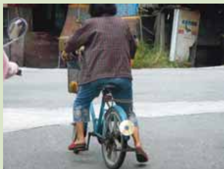
圖6 鹿港街頭老阿嬤的創意腳踏車