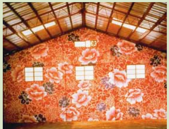
圖3 林明弘 台灣棉被花布圖 1998（引自李維菁《商品·消費》，110-116。）