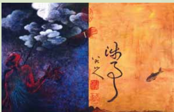
圖4 陳英偉 Art 1 by 1 (作者提供) 陳英偉的作品雖屬平面繪畫，卻有鮮明的議題表達。筆者認為形式與技法並非主要問題，重點還是在美學內涵的呈現。