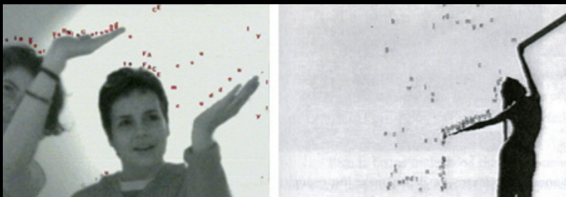
圖1 Camille Utterback & Romy Archituv Text Rain 2000

「字雨」的創作概念及融合以上所說的二個創作概念，也就是「玩」與「經驗設計」。藝術家要傳達的不只是他個人創作，而是作品與觀者之互動經驗。若是沒有觀眾的參與，則無法「完全作品」，作品只是一個半成品，一個有許多文字從螢幕上不斷掉下的一段影片罷了。但是反過來說，觀眾並非創作了全部的作品，他們是參與者，也是創作者。「字雨」就是一個很好的例子，說明觀眾在數位作品上所扮演的角色，還有互動藝術與其使用者之間的相互關係。