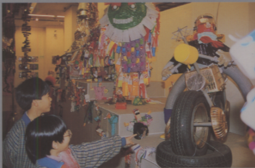
看到自己的作品在國家級藝廊展出，比誰都高興。