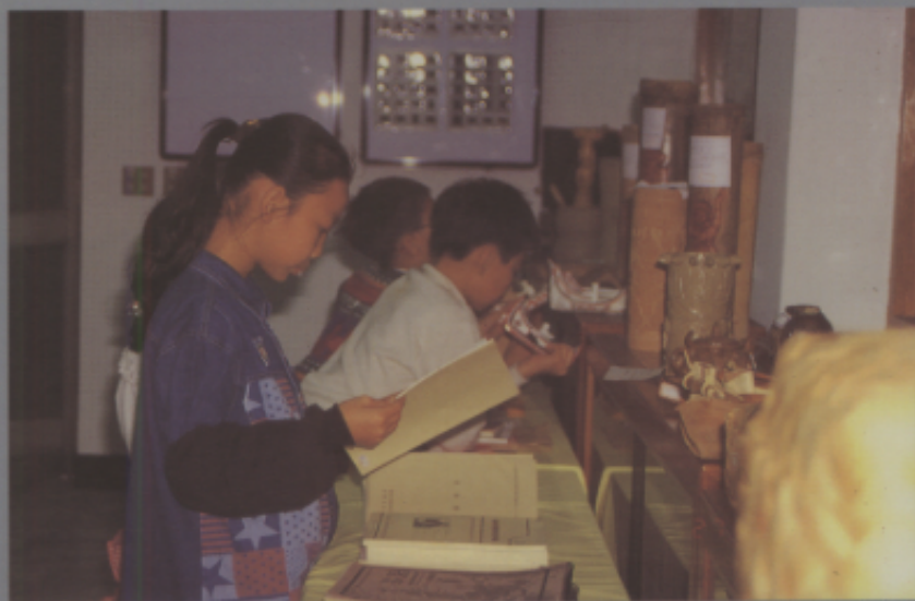
學生在美勞資源展示室中查閱資料。