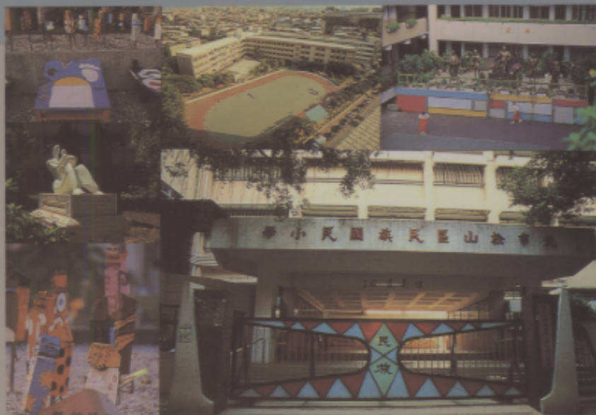
充滿藝術氣息的校園—臺北市民族國小