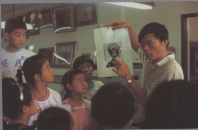
作品完成後，老師引導鑑賞，學生也發表自己的心得與看法。