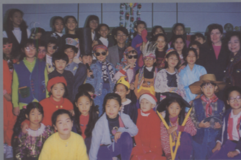
美術班孩子的才能是全方位的，化粧、表演更是創意的表現。