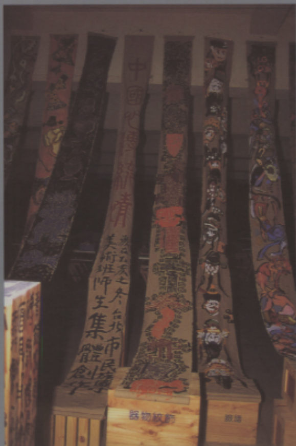
「中國心，傳統情」集體創作，大型展示條幅。

七、加強交流拓展視野——美術班學生有較多的機會接觸來參觀的外賓，參與國際城鄉交流活動，不論展覽、比賽、表演或訪問是付出亦是難得的統合學習經驗。