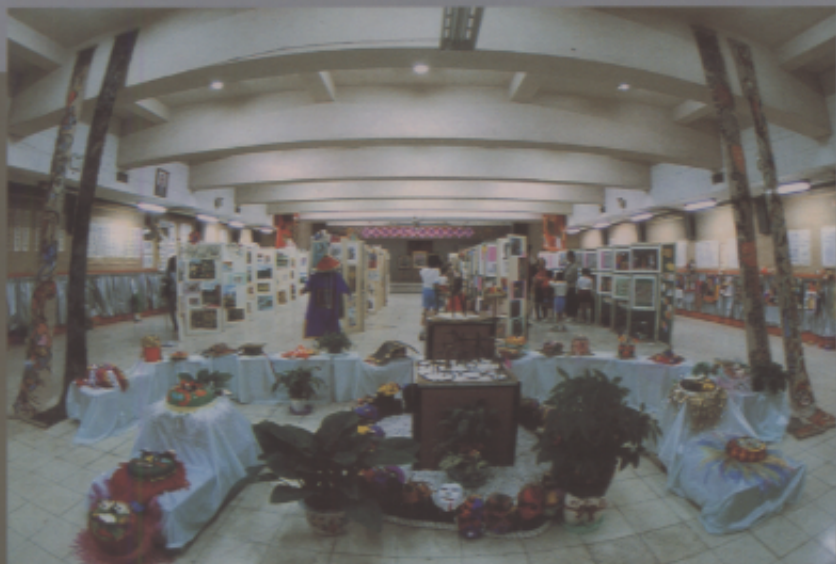
美術班的每一分子用心佈置一個校內畫展。