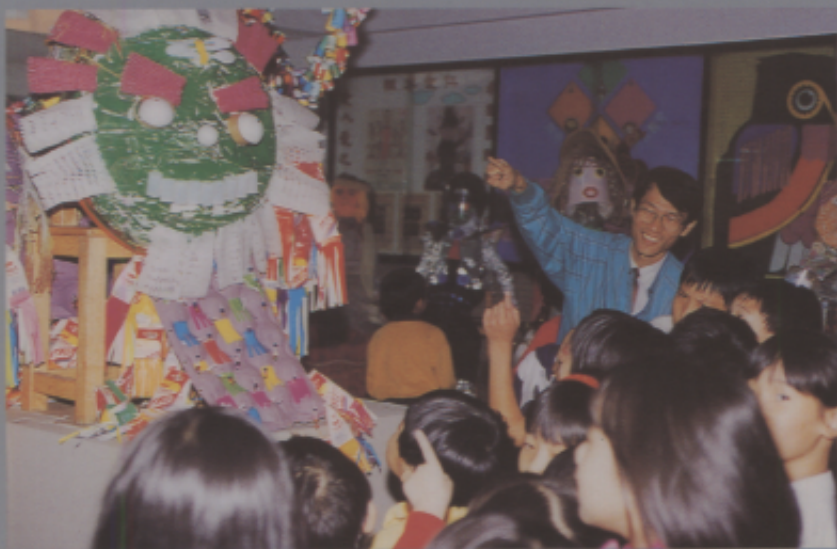
校長帶領小朋友發現「化腐朽為神奇」的新天地。