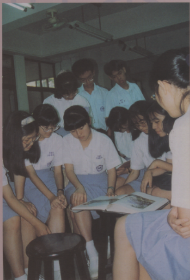
臺灣美術班學生課餘時間討論畫家作品情景