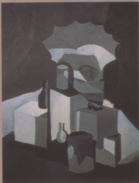
〈作品一〉靜物畫 黑白色料，女，12歲，六年級 〈解 說〉國小高年級兒童能如此敏銳而又熟練地表現明暗層次與空間感，頗為難得。