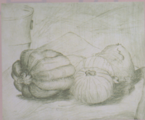
美國美術資優生作品

〈解說〉這幅版畫，凹凸版混用。魚、蟹是海島常見的題材，與美國印地安納州學生比較之下，更能顯現臺灣作品的特色。