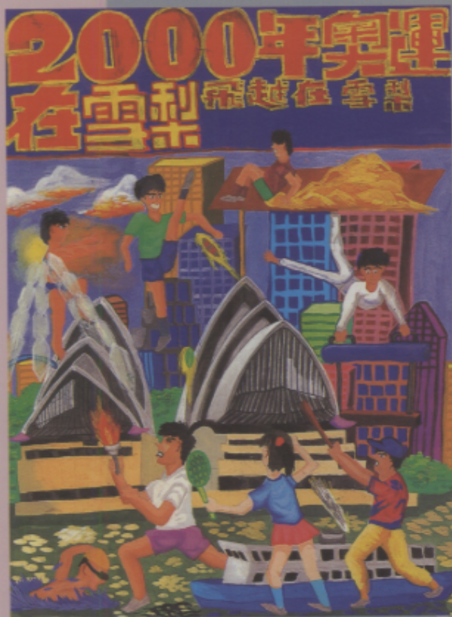
〈作品十〉2000年奧運海報 設計，卓文仁，男， 國小六年級

〈解說〉這幅海報設計，人物動作變化生動有趣， 又具有循環銜接的感覺，色彩強烈，視覺 效果佳。