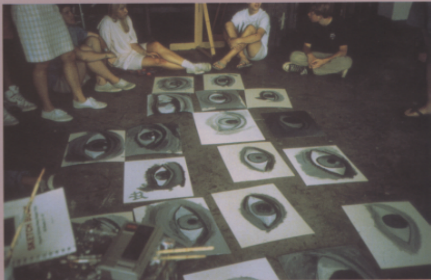
美國美術資優學生在上課時進行美術批評教學情形