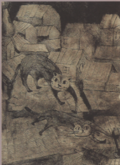
〈作品八〉屋頂上 版畫，王蕾瑩，女，國二

〈解說〉這幅版畫的構圖特殊，傳達出來的情趣令人覺得溫馨有趣。與美國學生〈作品七〉比較起來，雖然手法相似，趣味卻大不相同。