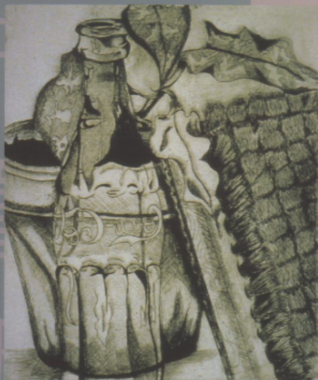
美國美術資優生作品

〈解說〉這幅美國學生作品，採素色描繪方法， 運筆沈穩有力，對十三歲學生而言，真 是難得的素描作品。