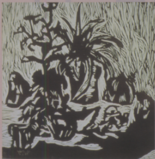
〈作品九〉靜物 凸版畫，男，13歲，七年級

〈解說〉凸版畫可以透過刻版的過程，使平凡的素描作品轉化為活潑有趣的創作成品，頗值得推廣。