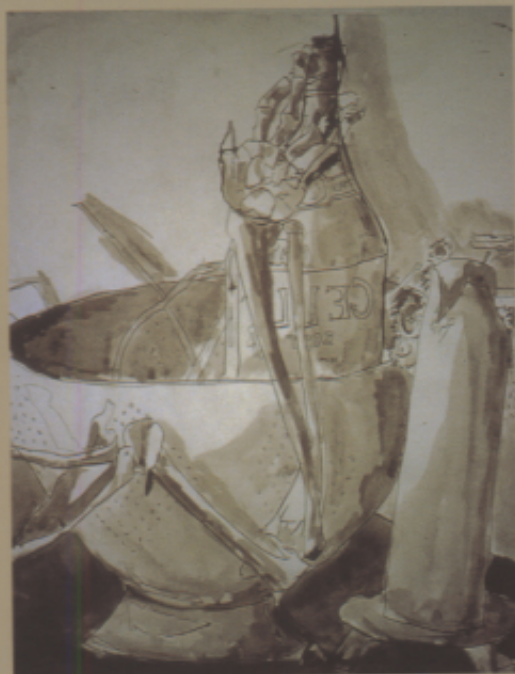
美國美術資優生作品