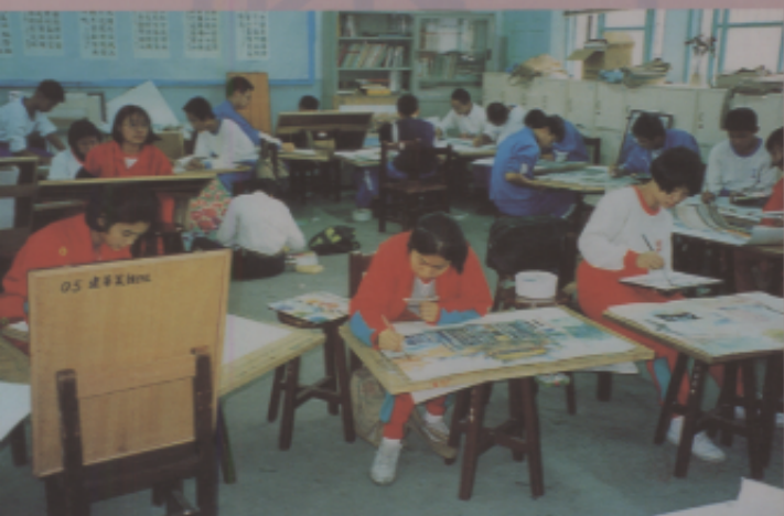
臺灣美術班學生課堂作畫情景