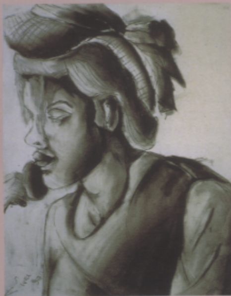
〈作品十五〉自畫像研究 炭筆畫，女，16歲，十一年級 〈解說〉這幅自畫像充分表現炭筆的特色，配合畫者的敏銳表達能力、視覺效果與〈作品十二〉迥然不同。