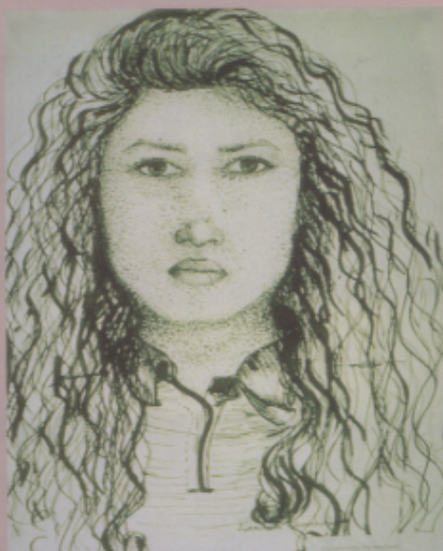
〈作品十三〉自畫像研究 墨水畫，女，13歲，七年級 〈解說〉自畫像是人物畫的訓練過程中，最容易入手的題裁。美國學生的流暢筆觸與大膽運筆方法，充分顯現其強烈的自信心與觀察力。