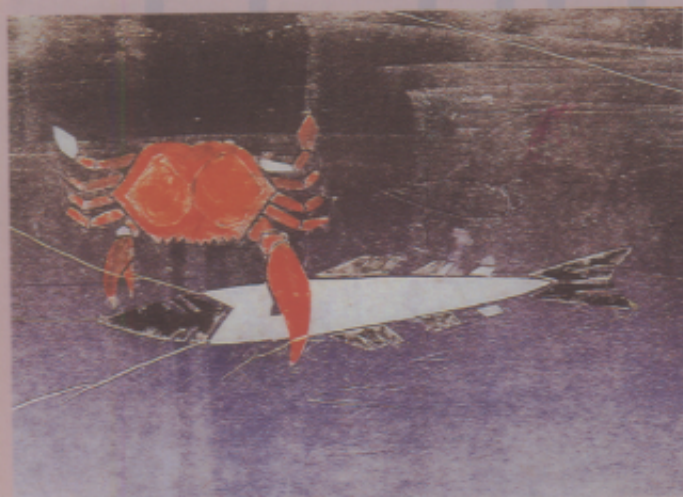
臺灣美術資優生作品