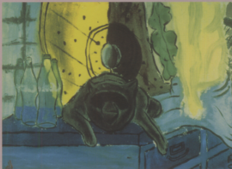
〈作品八〉靜物 壓克力顏料，男，13歲，七年級

〈解說〉壓克力顏料屬於快乾色料，可表現水彩趣味也可顯現油畫特性，對於愛好嘗試不同媒材的學生而言，這是甚具挑戰性的畫材。使用時，必須在十分鐘內清除畫筆上的顏料，以免工具遭到傷害。