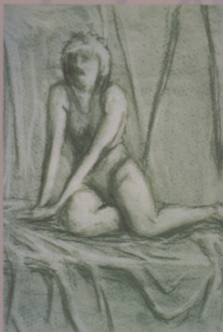
〈作品名〉生活素描 女，十四歲，八年級

〈解說〉這幅素描，以日常生活所見的雨具作為刻畫對象，充分顯現臺灣是個多雨地區與美國印地安那州有著不同的自然環境。