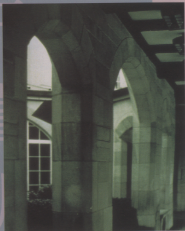
美國美術資優生作品

〈解說〉攝影作品得來容易，但取景、採光、都要 細心觀察與構思，如果連暗房作業也要 學好，那麼，學生們就必須費更多的時 間與心神。臺灣的學生學業的壓力大， 空閒時間少，因此可以延後學習暗房作 業。