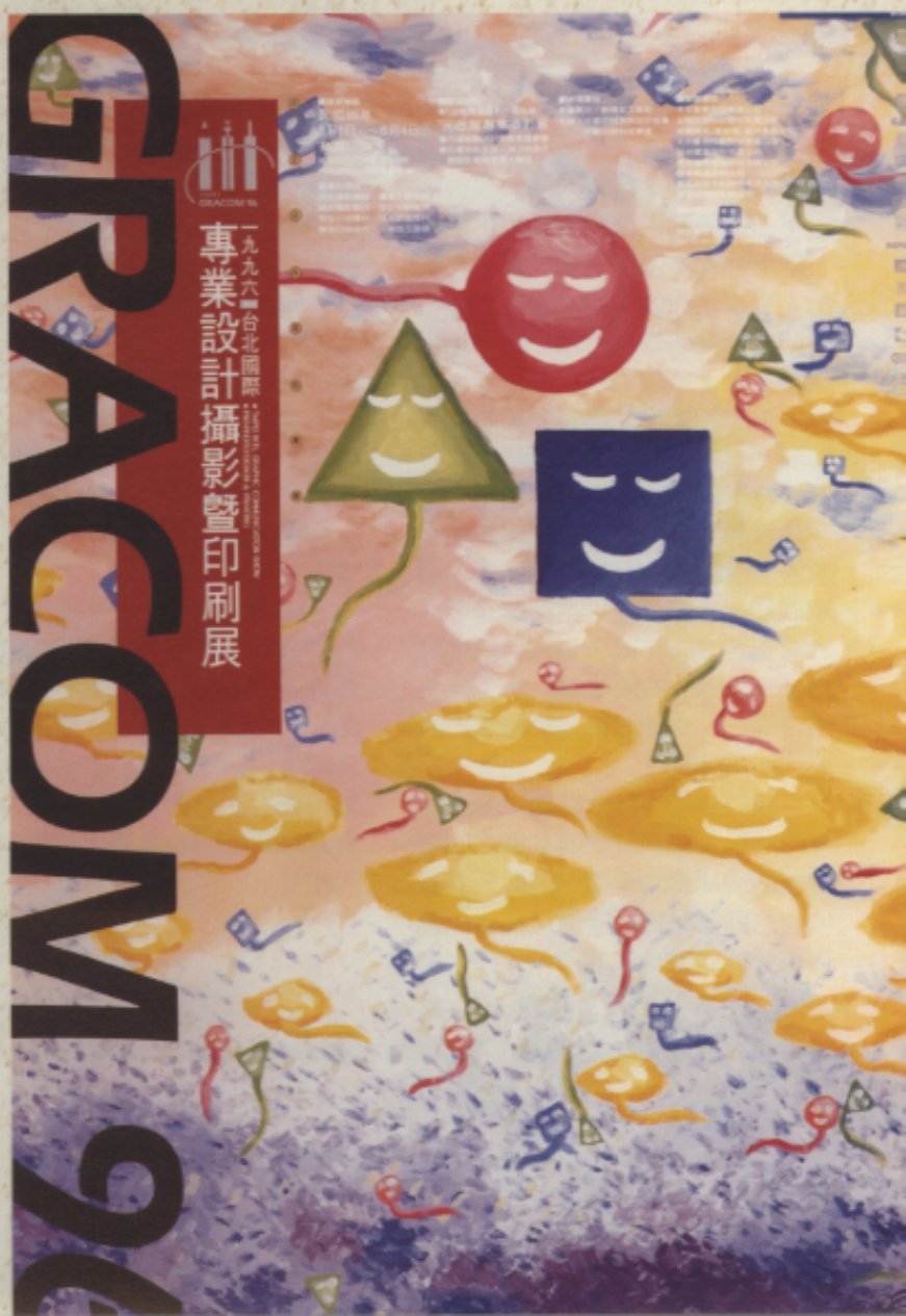
1996 台北國際專業設計攝影暨印刷展海報 設計/楊宗魁 插畫/王士朝

但是在另一種非常大眾化、社會化、生活化的藝術表現中，便可彌補上述缺失，就是——「商業美術設計」，由於都是以「視覺」為主，故總稱為「視覺設計」。它的範圍很廣，幾凡日常生活中所接觸到的各種物品，如廣告設計、圖書期刊、海報、卡片、名片、信封信紙、包裝設計等，可說在食、衣、住、行、育、樂裡，處處都充滿了「視覺設計」的藝術表現。