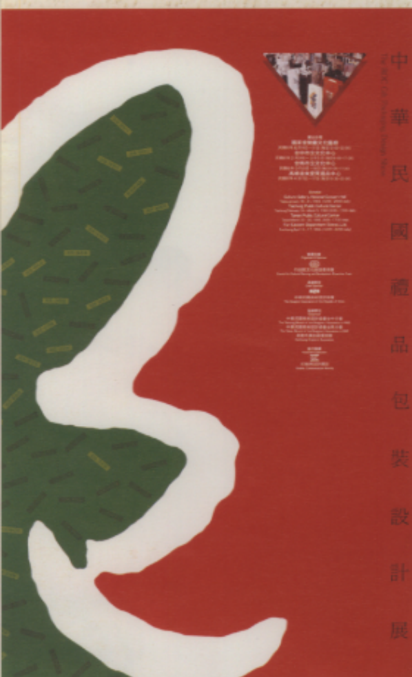
1993 中華民國禮品包裝設計展海報 設計/楊宗魁