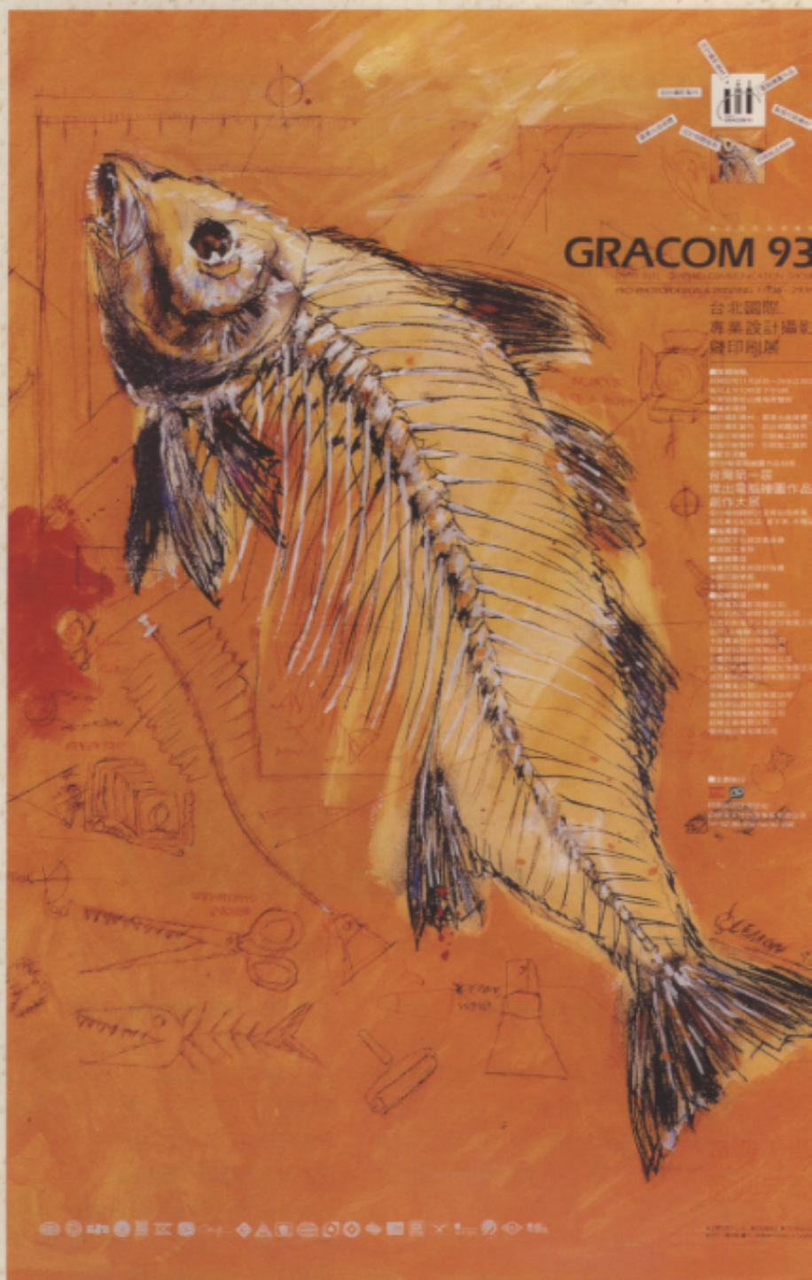
▲ 1993 台北國際專業設計攝影印刷展海報 設計／楊宗魁 插畫／林萌。

四、 促進國際間交流 ——特別邀請國外優良設計作品參與展出，以提供國內設計界觀摩參考，了解國際間的設計新趨勢，並也介紹國