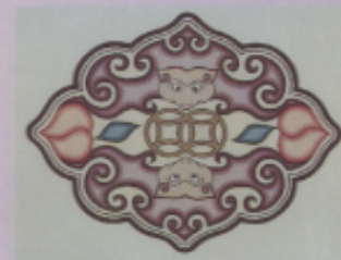
▲ 圖十二 「福在眼前」（丁誦如）筆者為第三冊《國中國文》之封面設計。