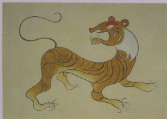
▲圖三二 「虎」展新貌 (蕭漢君)(許美美)(劉建國)(邵禮婷)