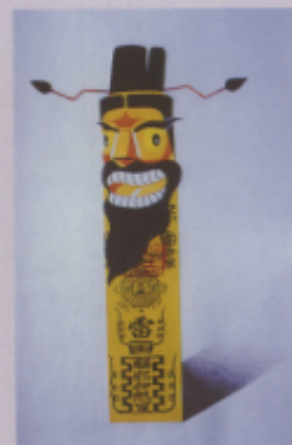
▲ 圖八 學生作品「現...、也很討人歡喜。 涂俊仁）