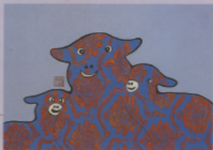
▲ 圖十 「三陽開泰」（美美齊）