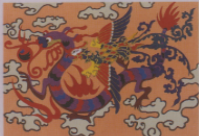
▲圖二十 「春到人間」 (張盛權)