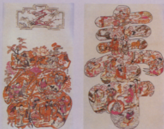
▲圖二三 「福字圖」(中堂) 540 × 960cm 「壽字圖」(中堂) 670 × 860cm 蘇州桃花塢