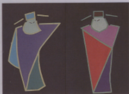
▼ 圖六 作品「現代門神」銳意創新，饒富趣味。（丁韶如）（楊秋實）（張博榮）（徐方正）（楊盛元）