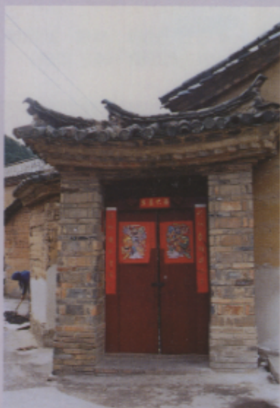
▲圖三 雲南鄉間漢族民宅正門上貼「武門神」與春聯（1992年攝）

這類型的門神年畫，一般都是二組兩張，貼在兩扇大門上（圖三、四）配合中國傳統建築的「均齊之美」，形式獨特平衡對稱的「聯」式模樣；在設色方面，絕少混合無彩色的黑灰白減弱彩度，而採以大面積的朱砂及桃紅為主色，配合著高明度的黃，彩度鮮豔的翠綠，寶藍等原色系，絢麗眩眼。以誇張手法，刻意將圓眼睛表現威武，以細長的眼睛表現斯文。身段比例與姿態也很講究，右門神是上身向左、下肢向右，左門神則反方向，加