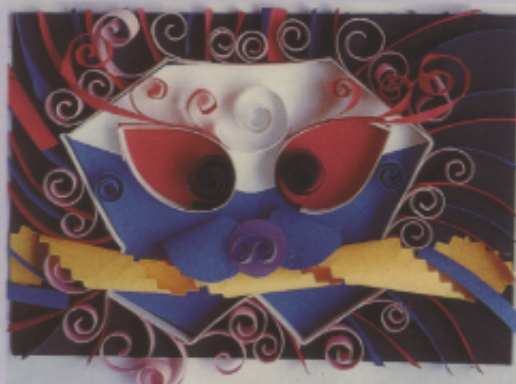
▲圖三一 「劍獅」系列 (楊孟玲)