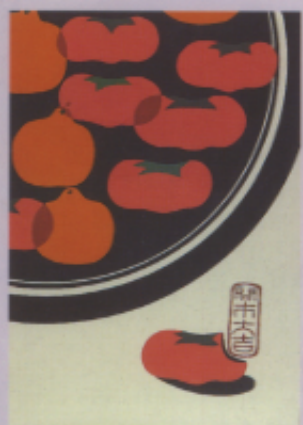
▲ 圖十三 「開市大吉」（陳麗秋）