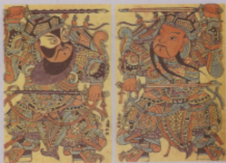
◀ 圖五 門神「秦瓊，胡敬德」河北武強（國立歷史博物館藏 1965 年攝）