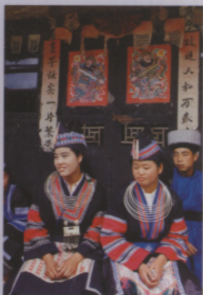
▲圖四 貴州中八鄉黑土寨苗族民宅正門上貼「日月門神」（1992年攝）

上挺胸凸肚，一橫一直的丁字腿，就顯得更加神氣、威武、穩重而又富有變化（圖五）。選擇如此富有變化的傳統「門神」作為教學創意主題，讓同學們先從傳統衍變中去欣賞古代民間藝術家們的造形美感，洞察體悟，觸發再創。這類的課題指導，我們不難從同學們的作品中，看出他們的敏感度與創造性的想像力，如此才能更豐富我們歷史中千古門神的生命力（參見學生作品圖六）。