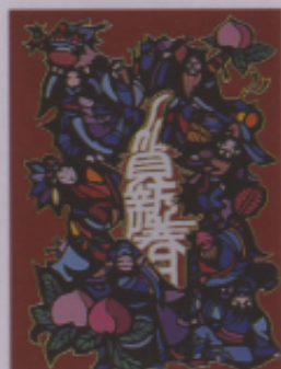
▲圖二一 「八仙獻壽」 (陳金 equal)

除了上述採諧音之物入畫的方式外，年畫的種類還可分為十二種，包括神佛仙官：如「天官賜福」(圖十五)、「三星照戶」(圖十六)；陸官發財：如「招財進寶」(圖十七)；寓意祈福：如「歲歲平安」(圖十八)、「龍鳳呈祥」(圖十九)；歲朝吉慶：如「春到人間」(圖二十)、「八仙獻壽」(圖二一)；仕女娃娃：如「連生貴子」(圖二二)；以上作品皆經由同學的資料分類中，擷取精華，融入自己的美學觀點，成績尚稱可喜。至於其他類別還包括風俗時事：如「拜月圖」、「得勝封侯圖」；民間傳說：如「老鼠娶親」；歷史故事：如「三國演義」、「文姬歸漢」；戲曲小說：如「水滸傳」；果報警世：如「朱子格言」；風景花鳥：如「內蘇萬