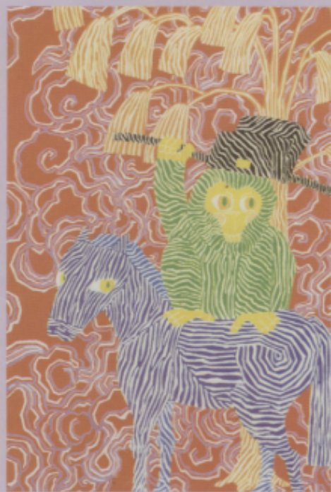
▲ 圖十四 「馬上封侯」（蕭漢君）