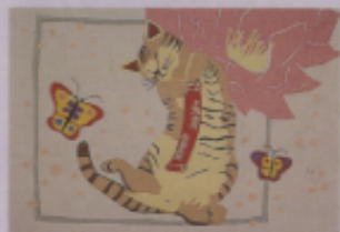
▲ 圖十一 「富貴耄耋」（徐德成）（黃明慧）