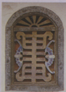
▲圖二六 「壽」字窗 飾 桃園觀音亭 (1972 年攝)