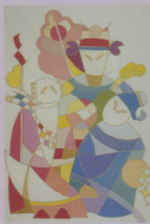
▲圖十六 「三星照戶」 (江舜典)