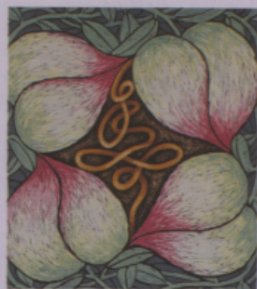
▼▲圖二七 漢字圖案「吉祥」(涂俊仁) 「財子壽」(江舜堯)「壽」(黃滄麟) 「百子呈祥」(柯俊任)