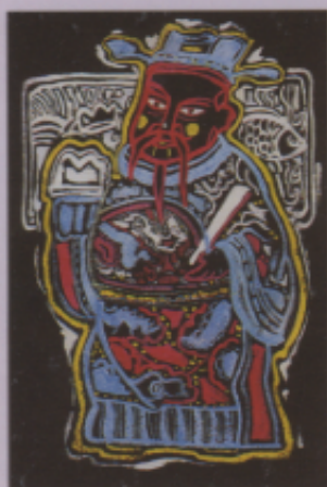
▲圖十五 「天官賜福」 (黃聖文)