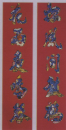
▲圖二五 「八仙慶壽」 花對子 四川綿竹