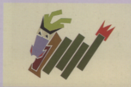
▲圖二八 「龍」展新貌 (楊震秋)(洪建樹)(馮藝賢)(蕭俊龍)(柯俊任)(鍾維)