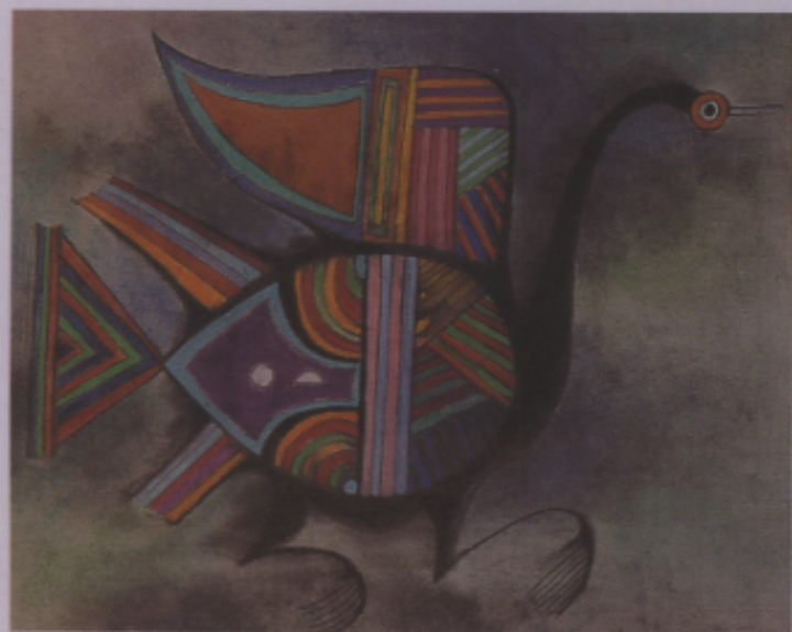
▲圖二九 「鳳」展新貌 (林麗春)(王孟玉)(龔同光)