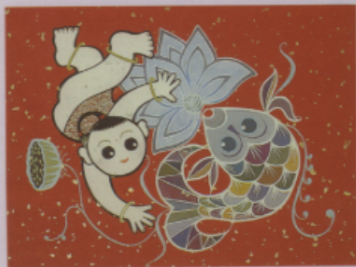
▲ 圖九 「連年有餘」（簡瑞勳）（陳東亨）