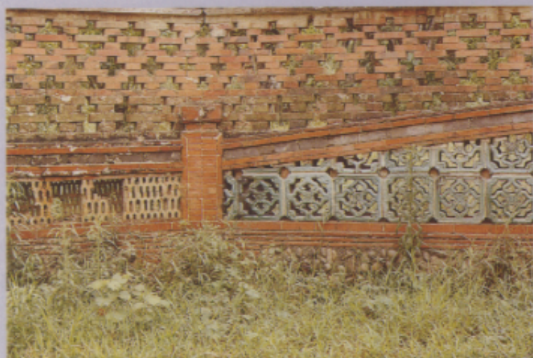
▲圖一 我們祖先擅用紅與綠、青與黃等「補色對比」的醒目配色效果。(1965年攝於台中霧峰林家古宅)