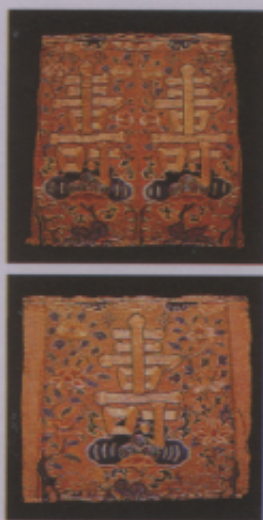
▲圖二四 刺繡萬壽 宦官補子一對 明 萬曆年間