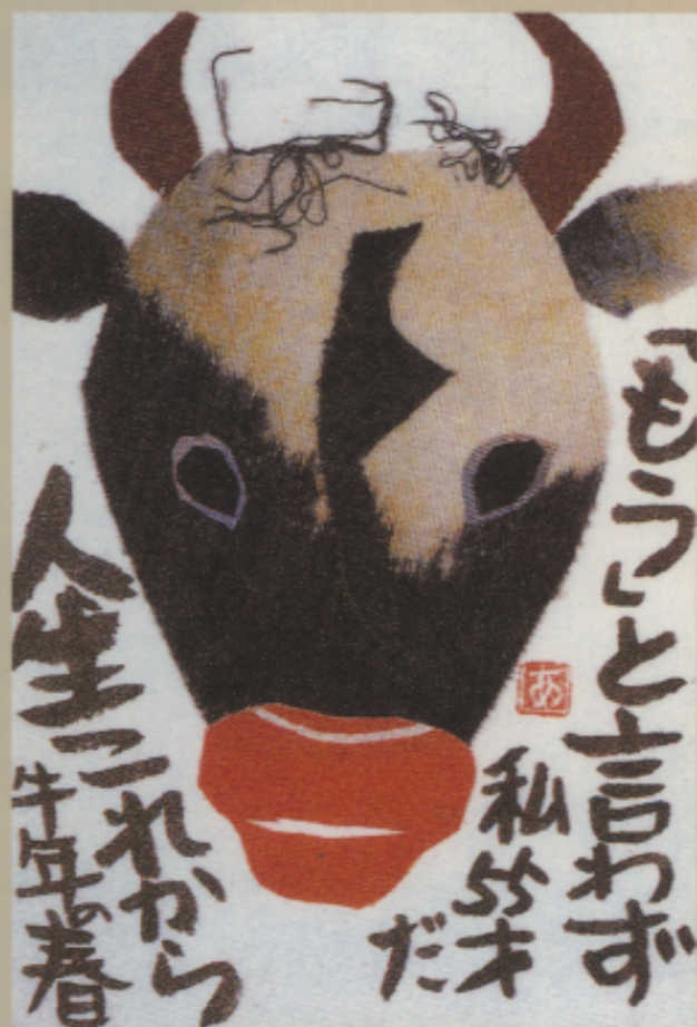
▲圖七 日本的兒童所繪製的「年賀狀」