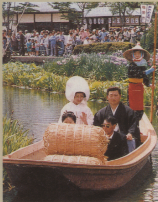
▲圖十一 用船代車迎親

灣的文化與色彩，同時讓他們認識了紅色、金色是我們在喜慶時的主要顏色。當時，筆者反問了那些日本孩子，他們的喜慶色彩是什麼顏色呢？相信你一定猜不到他們的答案（答案就在上述的內容裡）。他們異口同聲的回答「白色！」。有沒有嚇一跳？