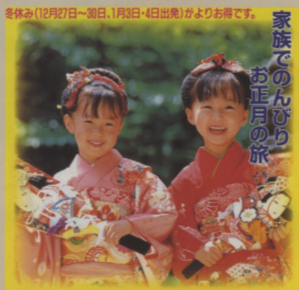
▲圖九 正月穿和服的女孩