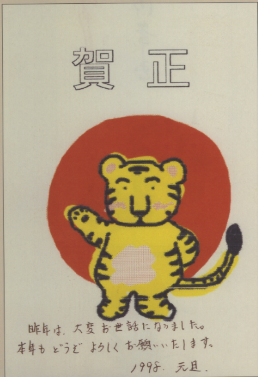
▲圖六 日本的「年賀狀」

以上這些有關日本的聖誕節、春節的景象之描述，相信已經足夠讓你歸納出日本在十二月、正月的幾個主要的色彩了。筆者在十二月中旬時，曾到一所小學去教授「國際理解」的課程，對象是六年級的學生。因正值歲末，所以準備了春聯、門神圖、壓歲錢袋、賀年片等台灣在過年，新年時令的應景教材。等到一一展示，說明後，全部用磁鐵固定在黑板上，才發現黑板上盡是紅紅、金金的燦爛的色彩。就趁此良機再給日本孩子上了一課台