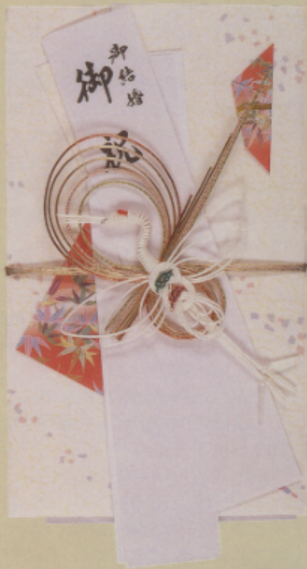
▲圖十二 裝結婚賀禮的袋子