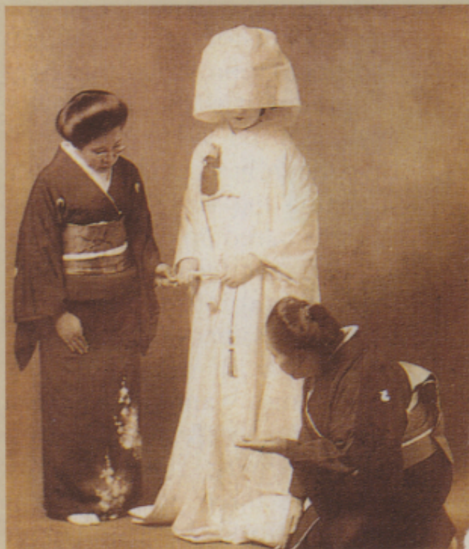
▲圖十 日本傳統的新娘裝扮