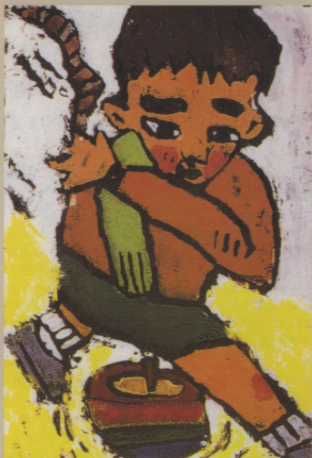
▲圖八 日本的年賀狀