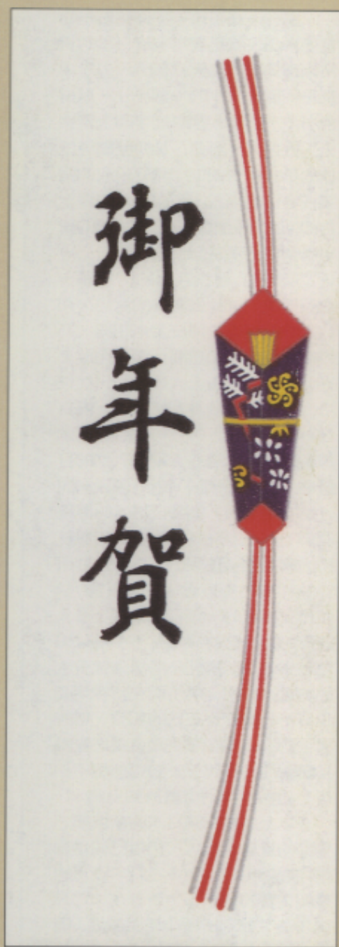
▲圖五 年頭的禮品包裝