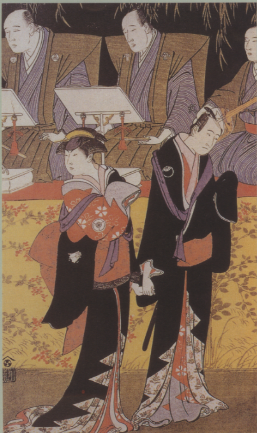
▶▲大專美術科系還可增加「現代美術史」、「日本美術史」、「非洲美術」、「台灣美術」、「民間美術」和「宗教美術」等課程。

至於所謂的「美術批評」（或「藝術批評」），簡單地說，就是「談美術」的意思。我們發現，目前一般人（甚至包括相當專業的人士）只要談到「美術批評」，就馬上聯想到要「客觀公正」。這當然是個理想的境界，不過也是個不可能的境界。或者，更明白地說，「客觀公正其實與美術批評無關！」這是一般人對美術批評的特性和功能的誤解所產生的期待。嚴格地說，所有批評都一定是「主觀的」。從事社會科學工作的人都知道，甚至連標榜「客觀公正」的科學民調，都避免不了主觀因素（亦即所謂的「目的性」）的影響。當然，好的美術批評，除了一定是「主觀的」之外，更重要的是，它必須是「超然