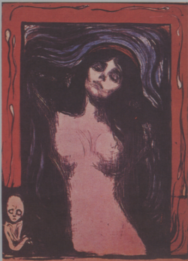
▲孟克 (E. Munch) 聖母像 1895-1902年

在三個成人組方面，三組對各項藝術功能的重視程度也有所不同，例如70%的藝術專業人士認為「樂趣」是非常重要的目的（53%認為是最重要的目的），藝術教師卻只有4%認為樂趣很重要。藝術教師組有57%認為「改變人的價值觀」是藝術的重要目的，其中30%認為是最重要的目的。相對的，成人