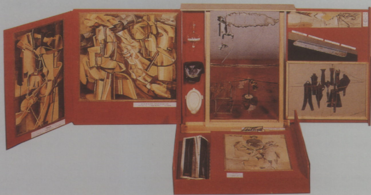
▲杜象 (M. Duchamp) 盒子 1938年 巴黎國立現代藝術館藏

十人以上提及的目的還有四類，其中有一類提到人創作藝術是因為喜歡或想要創作，共有二十三人，全部是11歲以下的兒童。這些反應再次印證藝術的情感因素，以及藝術與樂趣的關聯。成人非藝術專業者還強調藝術與創造力的關係（7人），這個目的在藝術教師、美術館專業人士、兒童與青少年組，提及人數都在三人以下。