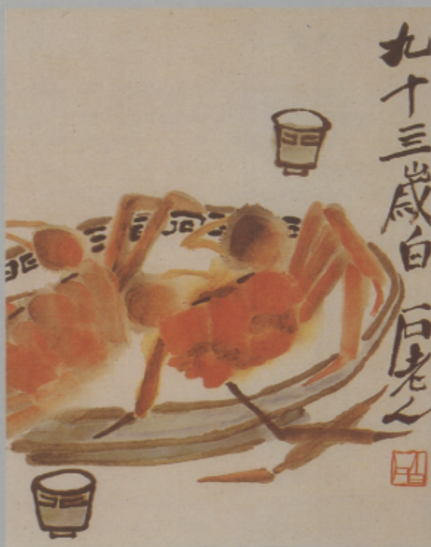
▲齊白石「金樽玉樓，蟹肥酒香」

有兩大類，一是開放式的訪談，詢問受訪者認為藝術的目的是什麼，二是選擇題式的問卷，從大約二〇項有關藝術目的選項中，選出二項最接近其藝術觀的敘述。4-5歲的受訪者只做訪談，中小學組的問卷也比較簡化，只要受訪者選出他們認為最重要的三項藝術目的。成人組的問卷題目則是「以下藝術的功能有何重要性？」，回答分為「毫不重要」到「最重要」五個等級；其次再圈選出他們認為最重要的兩項功能。在實際訪問中，我們發現多位成人（尤其在台灣），遲遲無法做決定，最後選了三個功能，而非兩個。為求三個文化的分析一致，我們將成人組中「重要」到「最重要」的回答綜合討論，與兒童、青少年組的回答對照比較。