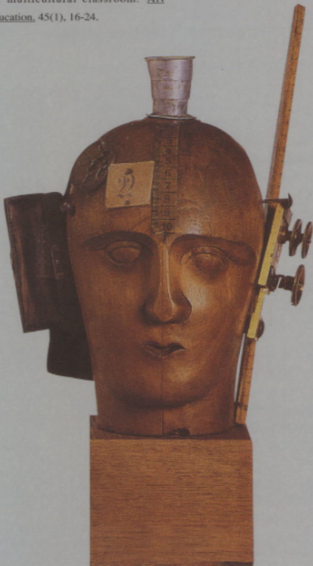
▲豪斯曼 (R. Hausmann) 我們這年代的精神 (機械頭) 1919年 巴黎國家現代藝術館藏