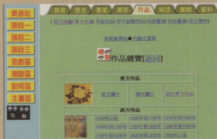
▲「美術作品」的查詢區

欣賞教學，在人力、資料、經費方面，都非常缺乏，雖然大多數學校都利用學校場所及活動機會，舉辦學生作品展覽，但次數並不多。「不論中小學、規模大小、社區及縣市，美術欣賞教育均未落實」(5)。