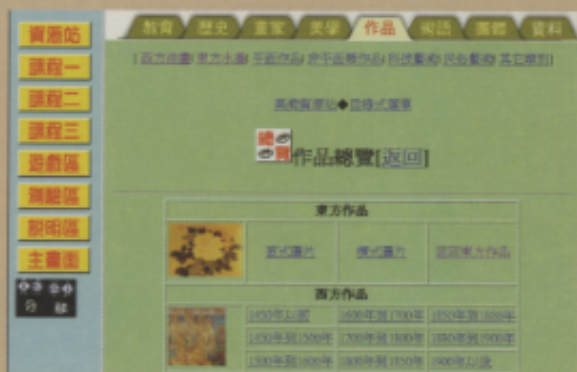
▲東西方美術作品依年代分類的情形