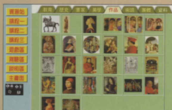
▲將名作以縮圖列出，一目瞭然