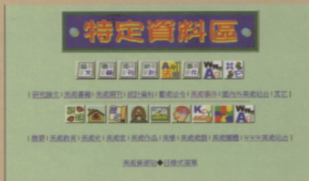
▲「特定資料區」的首頁