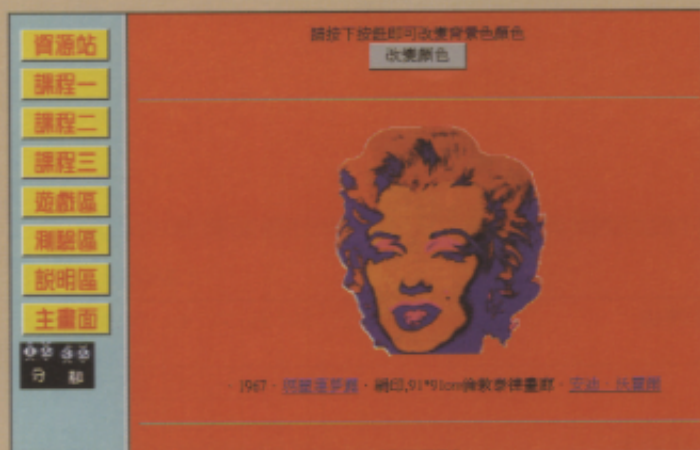
▲「遊戲區」裡的變色遊戲單元