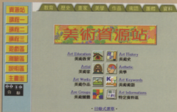
▲「美術資源站」的首頁

然而，現今藝術鑑賞教育的施行成效不彰，其原因眾多；而網際網路的發達，則提供了另一個全新的推行管道，有助於藝術鑑賞教育