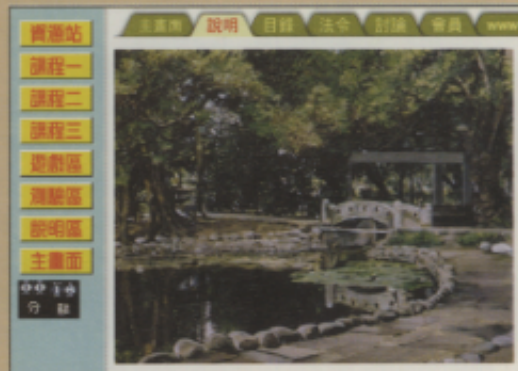
▲欣賞油畫作品的情形