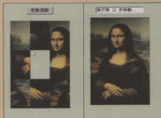
▲拼圖遊戲使得學習過程不再枯燥