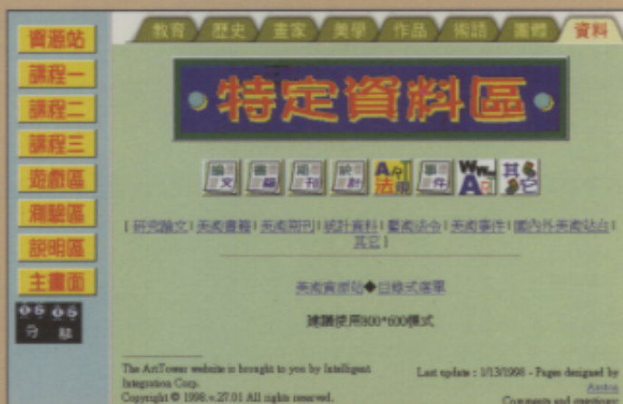
▲「特定資料區」可以查詢各種美術資訊