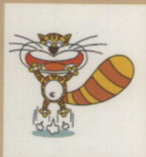
▲可適時增加可愛的動畫