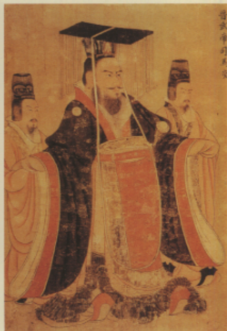
▲唐 國立本 歷代帝王圖