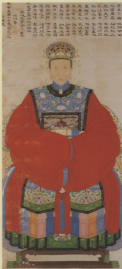
▲清 金照鑾翰林題姿城侯夫人像 紙本 173×78公分

為詳盡的說明，例如面相學所謂的三停五部位，天三地四的分法，如何畫出鼻形和五岳，如何添眉畫鬚，都有一定的法則。畫官像的家庭既然都有相當的家世和地位，也即是一般人所謂具富貴、福壽之相，因此將若干相法的特徵如所謂「天庭飽滿」、「地角方圓」，等的原則應用於作品上，也易於為家屬所贊同。中國人早些時期是沒有所謂「光影」觀念的，但多次暈染，作品一定要畫在絹本或經過礬水的紙本上，因此如何上礬調膠，礦物性的色料如硃砂、石青、石綠等的調