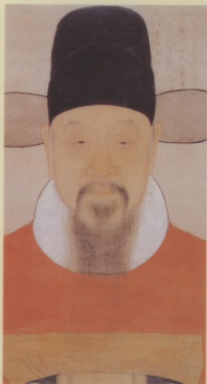
▲明 佚名 徐光啓像軸 紙本 設色 27.7×86.8公分

開始直到乾隆三十一年，在宮廷中工作了五十一年，並帶回了王致誠和艾啓蒙等人共同以凹凸的丹青法受清廷的重視，乾隆對郎氏寫真的工力直認無人出其右，故院畫中作乾隆像時什九均出自郎氏手筆，尤其唐英與郎氏合作譯出「透視學」即所謂海西焦點透視法，普遍應用於宮廷繪畫中。除御像外，重要慶典節目時外藩的功臣均囑畫院作油畫或水墨法畫成肖像，郎世寧年老不宜遠赴熱河時，則由王致誠等專程去寫像，畫像可說極一時之盛。圓明園興建中，郎氏等繪成數以百幀的油畫，可惜均為八國聯軍亂火焚毀，否則必將流傳驚人數量的作品。郎氏由於身在中國，力求融和中西繪畫特色，可謂為屈就中國國情而形成以折衷觀念表