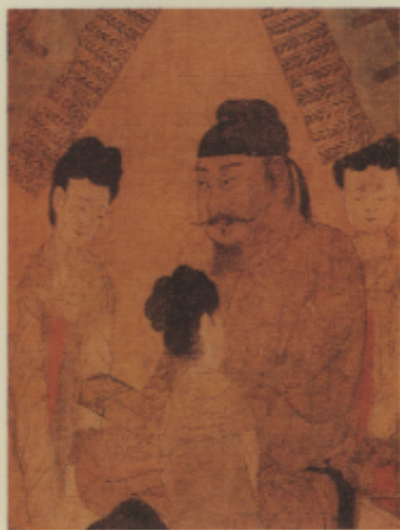
▲唐 國立本 步鼙圖卷（局部） 絹本 設色

潑墨意寫知名的梁楷及晚宋的牧谿等人，都能精通數種畫科。敦煌地處邊陲，政府無力遍顧，曹議金及其子曹元忠，孫曹延祿等多年任歸義軍節度使，並與回鶻、于闐等國交往或結親，開鑿洞窟，將家屬相關人員均繪成供養人像於洞口甬道二側，包括于闐國王李聖天及公主等之肖像，其衣冠制度，足以補服飾史上之不足，為彌足珍貴之肖像史料。甚至包括早期吐蕃（唐時代）至宋以後西夏統治敦煌之近二百年中，有不少洞窟中留下了他門貴族們的供養像。敦煌由於開龕造像始終不絕，當地畫工依此為生的為數也不少，曹氏統治階段甚至仿照中原情形成立「勾當畫院」，所以畫院高手留下的作品在洞壁中保存了下來，代替了中原許多唐宋寺廟繪畫毀於兵燹火災史料的不足，其重要性由此可知。