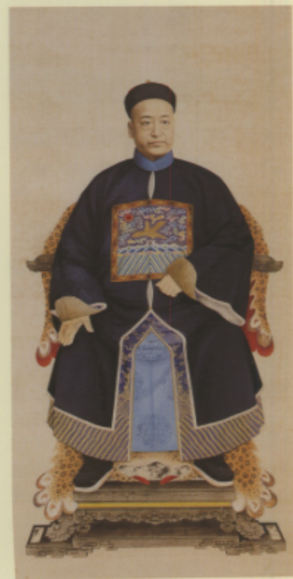
▲清 臺灣萬華鸞補官像圖軸 紙本 141.5×75公分

官像畫家由於藝術性較諸一般專業畫家的水平略低，因此在秘訣或訣要等的著述中，有著頗