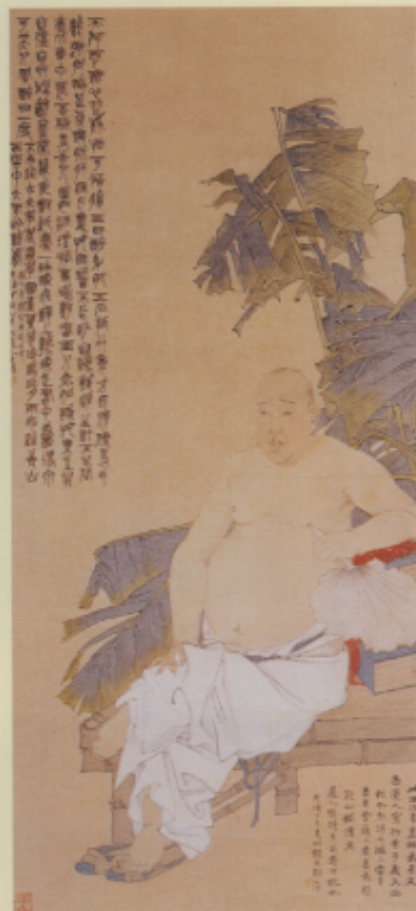
▲清 任頤 蕉蔭納涼圖軸 紙本 設色 129.5×58.9公分