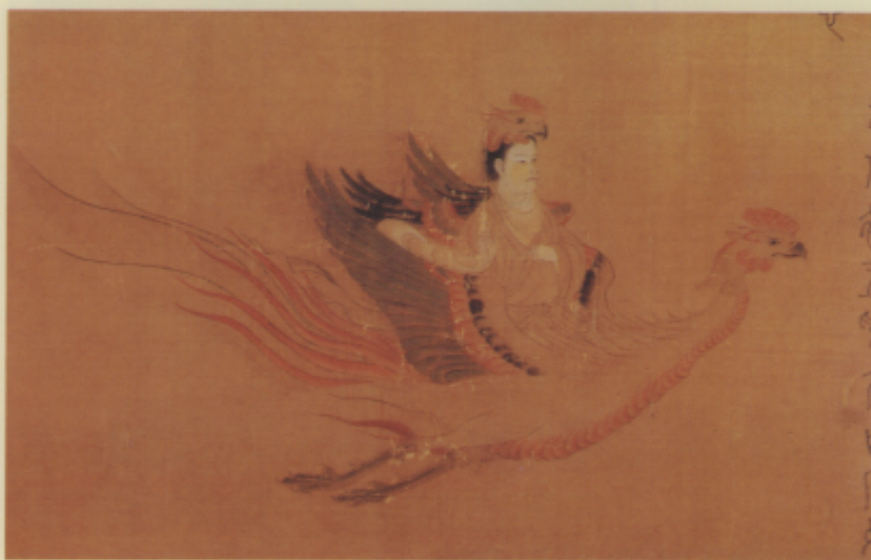
▲梁 張僧繇（傳）五星二十八宿神形圖卷（局部）

人物畫的內容大大增加，他作畫衣紋骨法(1)可能有所缺失，他卻能注意到形似以上的「以神寫形」的重要性。他作殷仲堪像，殷氏眼有白內障，他在畫瞳仁時輕拂白色如輕雲蔽日。作謝鯤因他為高士，故置身於山巖間。畫裴楷在頰上添畫三根毫毛，頓覺神明愈勝(2)，所以顧愷之不僅畫出形象，更以獨創的意匠強化並塑造對方鮮明的個性。他的「傳神寫照」卻在阿堵中(3)，更是膾炙人口的畫論，佛像製作強調了開光，張僧繇的「畫龍點睛」，都是說明了眼神實是形象內在精神表出之處，是作肖像畫時應牢牢掌握的。