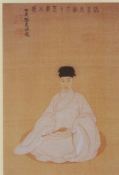
▲明 曾鯨 王時啟小像軸 絹本 設色 64×42.3公分