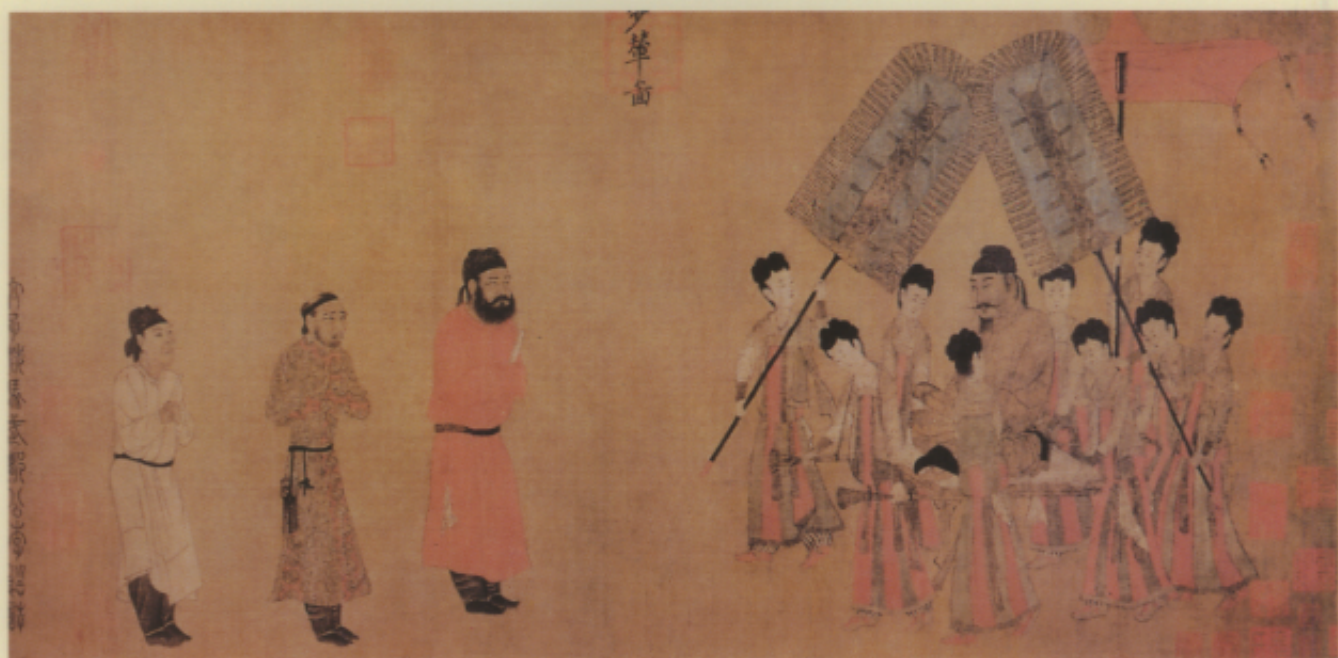
▲唐 國立本 步鼙圖卷 絹本 設色

潑墨意寫知名的梁楷及晚宋的牧谿等人，都能精通數種畫科。敦煌地處邊陲，政府無力遍顧，曹議金及其子曹元忠，孫曹延祿等多年任歸義軍節度使，並與回鶻、于闐等國交往或結親，開鑿洞窟，將家屬相關人員均繪成供養人像於洞口甬道二側，包括于闐國王李聖天及公主等之肖像，其衣冠制度，足以補服飾史上之不足，為彌足珍貴之肖像史料。甚至包括早期吐蕃（唐時代）至宋以後西夏統治敦煌之近二百年中，有不少洞窟中留下了他門貴族們的供養像。敦煌由於開龕造像始終不絕，當地畫工依此為生的為數也不少，曹氏統治階段甚至仿照中原情形成立「勾當畫院」，所以畫院高手留下的作品在洞壁中保存了下來，代替了中原許多唐宋寺廟繪畫毀於兵燹火災史料的不足，其重要性由此可知。