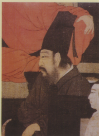
▲五代 顧閔中戴夜宴圖卷（局部） 絹本 設色

二是民間肖像，亦稱「壽相」，有的在生前，甚至在臨終前時刻，僱民間以畫遺容為職業的藝人（即畫像師）前來作畫。民間藝師也有固定的工作場所，兼繪些寺廟的功德圖或與裱畫店合作，畫些吉祥性的題材賴以為生的。民間俗稱之謂「買太公」或記眼 (6) ，像徐悲鴻的父親徐達章，在藝術作品出售乏人照顧時，祇能游走各地擔任過這類職業。齊白石也曾作過一段繪製「喜容」的工作，故宮藏有他為師母湘綺老人的夫人作過肖像畫，尤其對以黑紗羅的外衫罩袍，能表達其若隱若現內袍掛上的織紋更是齊