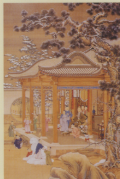
▲清 郎世寧等 弘曆雪景行樂圖軸