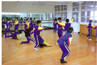
圖13 自我肢體表現 (一)