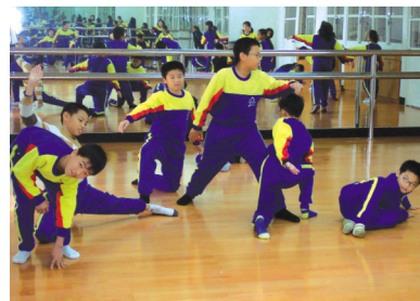
圖12 舞句的組合靜止造型 (二)