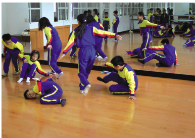
圖15 小組創作練習 (一)