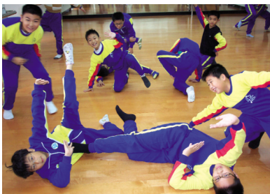
圖11 舞句的組合靜止造型 (一)