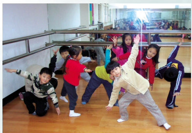
圖5 第一組的表演 — 舞句：快走+斜線