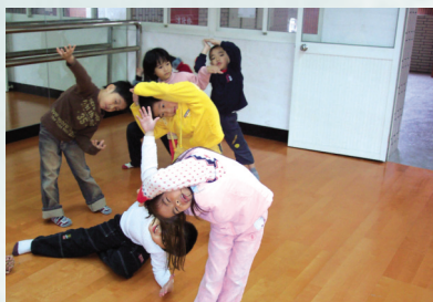
圖6 第二組的表演 — 舞句：慢走+彎曲造型