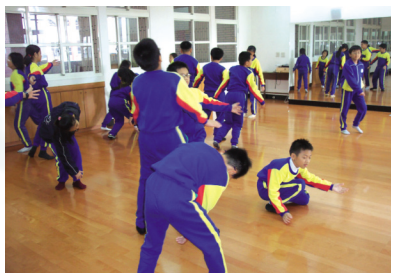
圖14 自我肢體表現 (二)