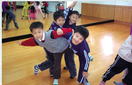
圖4 肢體的伸展 (群體組合)