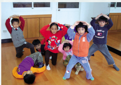
圖7 第三組的表演 — 舞句：快走+圓形