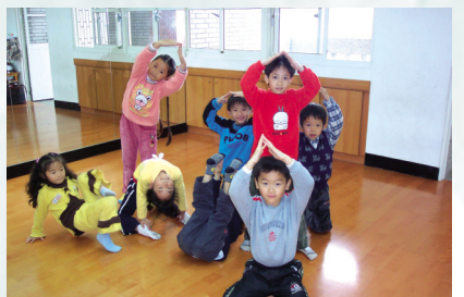
圖8 第四組的表演 — 舞句：慢走+三角形