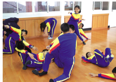
圖16 小組創作練習 (二)

課程說明：實施課程設計會依學生先前學習經驗進行設計，然而進行教學的過程中，偶而因為音樂屬性的不同，學生所反應表現出的情形會與原課程設計規劃有所不同，因而筆者的習慣會將每一節課學生所表現的情形做紀錄，並於下次上課時進行修改，甚而有時在教學過程中發現，某一班的學生在肢體呈現上已達到課程內容時，筆者亦會立即進行學習內容的改變，這也是自編課程的一大特色。