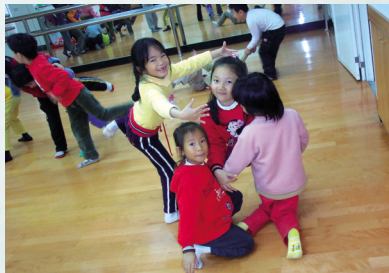
圖3 肢體的伸展 (群體組合)