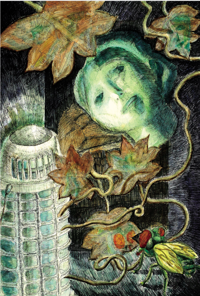
圖2 李一均 「關於蒼蠅的夢」 第一屆本競賽視覺藝術類 高中職組 特優獎

第一屆本競賽為鼓勵學生從事藝術創意發表，並提供其他師生觀摩參考，故參加對象為在學之國中、高中職及大專學生。參賽組別分為三組：國中組、高中職組（五專一至三年級）、大專組（含五專四年級以上，大學四年級以下）。徵選類別包括：視覺藝術及表演藝術（含音樂、戲劇、舞蹈）兩大類，前類作品以自行創作的視覺藝術作品之實物攝影為之，以數位相機或正片掃圖再行轉檔。後類表演藝術作品，限以自行表演之實況攝影為之，採單一鏡頭拍攝，時間以三分鐘為限。收件時間自九十二年九月二十二日上午九時開始至十月六日上午九時截止。國中、高中職、大專組三組錄取特優、優選、佳作各三名，特優獎金新臺幣三萬元，優選獎金新臺幣一萬五千元，佳作獎金新臺幣五千元（兩人以上共同創作，獲獎之作品其獎金平均分配）；上述各錄取者並致贈獎狀。 2