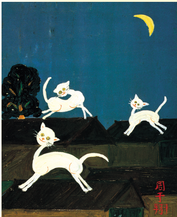
圖2 翔翔 開心的貓 國小 油畫 貓是翔翔最喜愛的題材之一， 貓感是來自鄰居屋頂上嬉戲的貓咪。