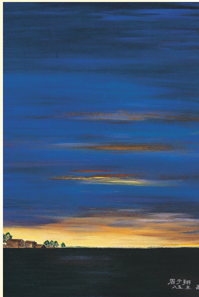
圖5 翔翔 天空 高中 油畫 這是一幅翔翔風格較特殊的風景畫，沉靜變化的天空帶給人無限的想像。