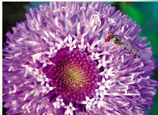
圖3 花異 (林妙俞攝於舊莊親山步道，2005年11月)