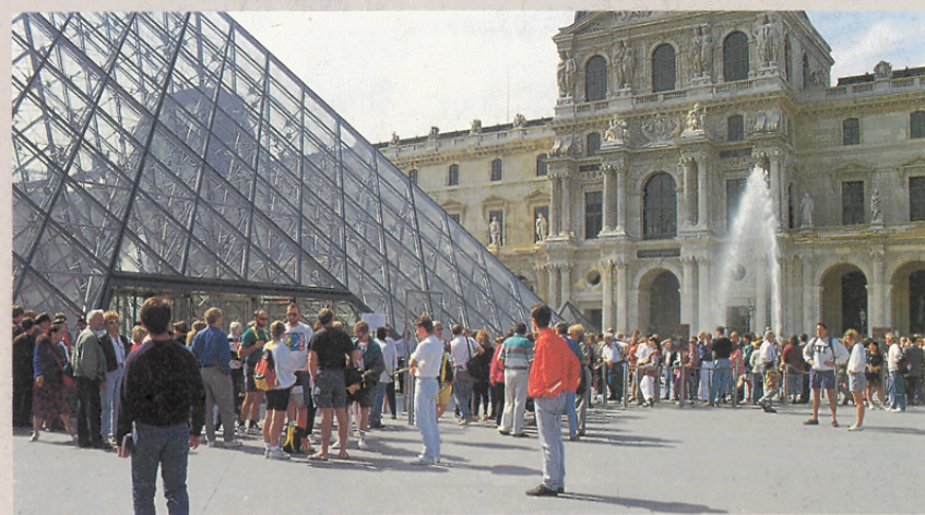
法國羅浮美術館(Louvre)每日人潮不斷成為世界性藝術教育重鎮。