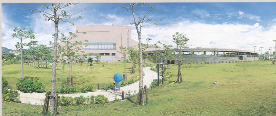
高雄市立美術館 內外聯結形成一幅美麗的畫面。

綜觀臺灣目前三大美術館之籌建過程，我們大略可以發現臺北市立美術館及臺灣省立美術館的興建是取決於行政首長，而高雄市立美術館之籌建是來自民意的呼聲再透過行政機關完成。由三所美術館籌