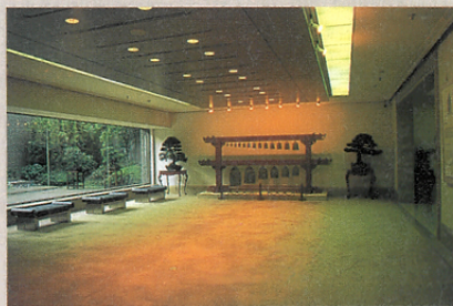
由財團法人鴻禧藝術文教基金會，創立於一九九一年一月十七日 鴻禧美術館在私人美術館裡，備受讚譽。