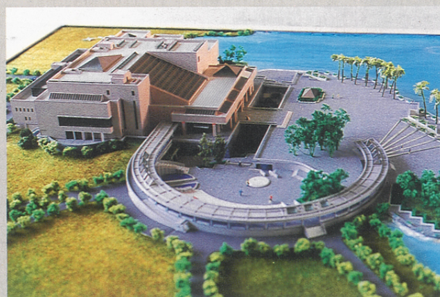
高雄市立美術館模型鳥瞰圖。