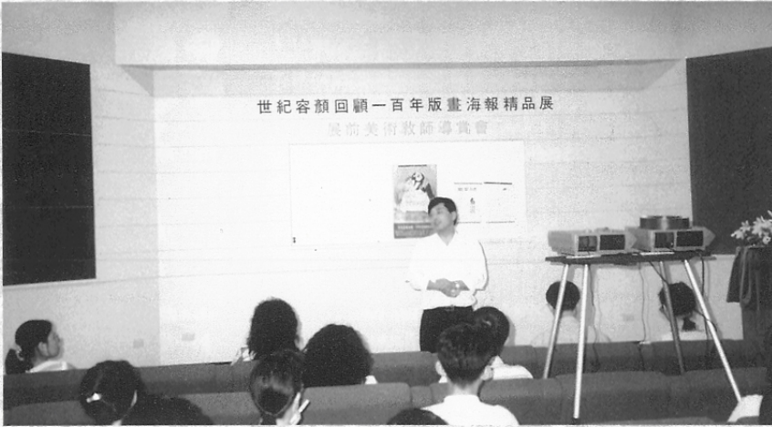
圖二 為落實博物館展覽與學校教育之溝通關係，國立臺灣藝術教育館在本(八十五)年十月份「世紀容顏回顧」展，展出前一個月，曾針對國、高中美術教師舉辦四場「展前美術教師導覽會」。

為，博物館與學校之間應建構一個良好的溝通管道，彼此合作相輔相成，以彌補學校教育缺乏實物教學的不足之處。誠如前國立科學博物館館長漢寶德先生所言：博物館強調直接經驗的學習效果，可以彌補課堂教育偏重於抽象思考的缺失。博物館強調的是啟發好奇心的學習動機，可彌補課堂教育比較功利之學習動機的缺失。(註一)