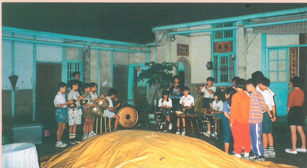
圖十 國立臺灣藝術教育館本(八十五)年七月~八月間「稻香懷舊」展的農村感性之旅中與苗栗縣銅鑼鄉南河國小建教合作的精采鏡頭。

已。大體上，博物館透過展覽、導覽解說或專家學者提供各種知識與活動給民眾，以達到其教育功能。在此要特別注意的是，博物館必需認清自己的角色定位，檢討是否於無形中取代了學校老師的角色？因為老師永遠是第一線的教學者，他們擅長解說，懂得學生心理。而博物館所扮演的角色，是站在引導者與輔導者的地位，並非將之定位於直接教育學生。而是透過博物館的專業領域，規劃各項活動，由博物館教育人員訓練老師，使其了解博物館功能，並將專業研究態度及方法傳授給老師，再由老師傳授給學生。如此師生間才能真正了解博物館的功能與善用博物館的資源，館校建教合作才能真正落實。近年來，強調博物館教育功能的聲浪與日俱增。要稱職得扮演此一角色，博物館應為學校教育系統的延伸。為達成這個目標，博物館應在館內提供許多活動與服務項目，並以解