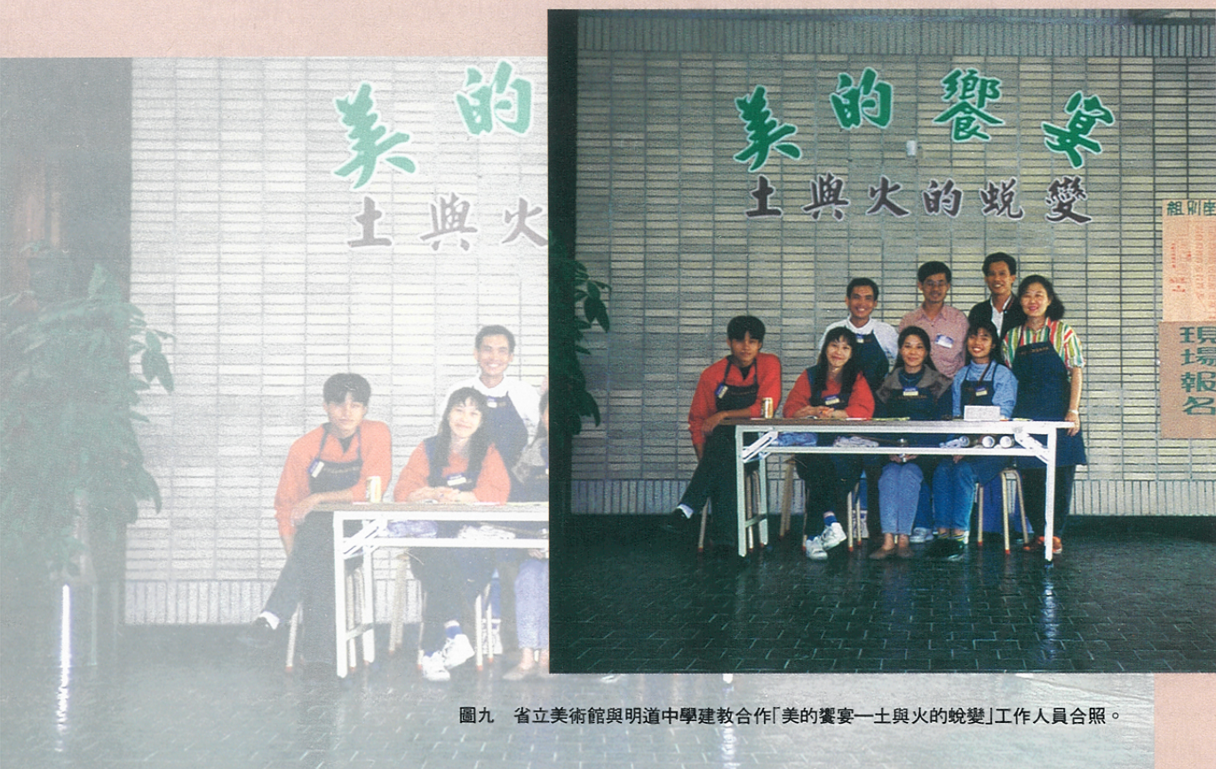
圖九 省立美術館與明道中學建教合作「美的饗宴—土與火的蛻變」工作人員合照。

的院生，對社會教育的影響更是深遠。因為他們可藉由學校課程中所安排的博物館學相關課程與博物館實習的親身參與經驗，使他們瞭解「如何利用博物館的資源，使其成為將來教學的一部份；並訓練他們了解如何在課堂上使用實物教學。」如此所培育之師資，瞭解社會上存在著許多豐富的資源可供應於日後的教學上，有助於他們跳脫傳統教學模式的束縛。另外，博物館應重視與提昇博物館教育人員的地位，多聘用具有專業素養的教育人員，鼓勵他們確實考量如何扮演博物館教育人員的角色。透過各種管道介紹博物館功能及發揮其教育功能，積極編寫有關博物館教育之刊物供各界參考。而非僅局限於行政工作的