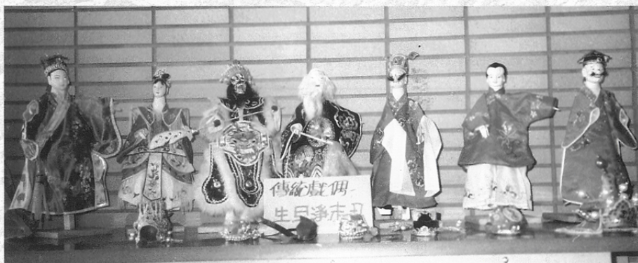
圖五 小小展覽—布袋戲偶展示、介紹。