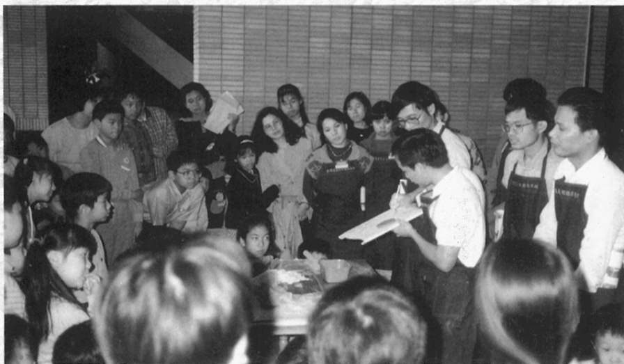
圖八 老師熱心指導陶藝製作方法。