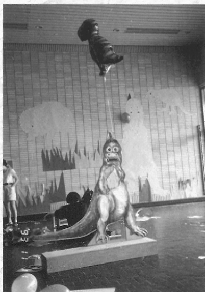
圖四 同學們花了很多心血佈置的會場。