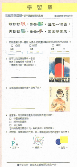
「世紀容顏回顧」展遊戲卡暨學習單。