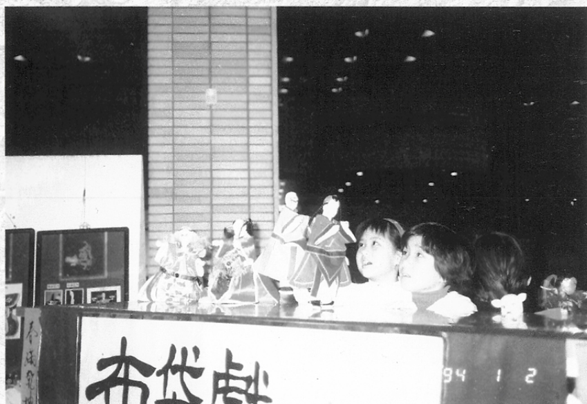
圖六 鼓勵小朋友上台表演操作布袋戲。