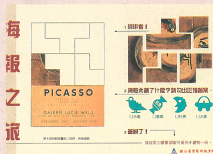
圖一 國立臺灣藝術教育館為深化藝術教育推廣內涵，自民國八十四年十一月起率先推出「看展覽玩遊戲」的互動式活動

代的博物館除具備上述功能外，還涵蓋教育活動。身為文化、教育機構的博物館，其所涵括的教育功能，除學術上之研究探討之外，進而如何將其諸多的研究成果回饋於社會也是重要使命之一。因此，近年來博物館學正逐漸重視教育議題的重要性。目前博物館所擔負的使命是如何順應民眾的需求，提供各項服務給民眾。基於此一理念，博物館正積極拓展其教育功能。