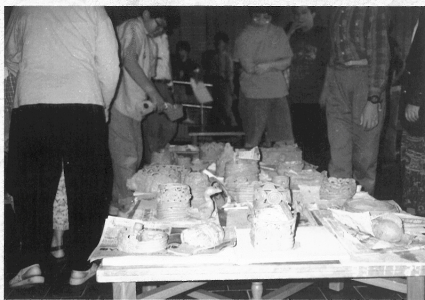
圖七 學員們陶藝製作成果評鑑欣賞。