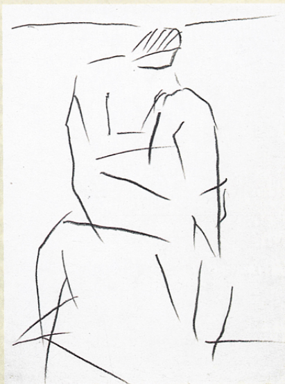
人體 1993 鉛筆 25×18 cm