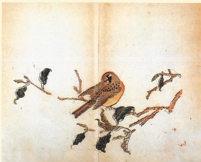
胡正言 翎毛譜 十竹齋書畫譜 明天啓七年(A.D.1627)