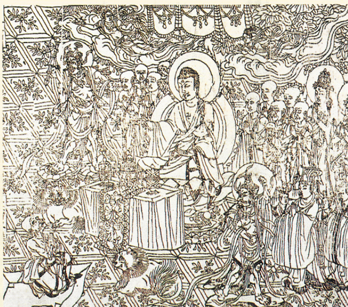
唐 金剛般若波羅密經A.D.868 凸版 (水印木刻版) 24.5×29 cm