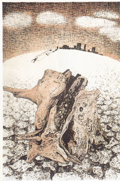
王振泰平版作品 「歷史／瞬間—破壞與建設」 90×60 cm

2. 李景龍的橡膠版畫和木口木版畫，是國內一直堅持以傳統師傅般胸懷經營的作品，由於傳統雕刻方法費時耗神，因此從水族系列作品中，可以看到作家精湛的技法，當然作品中「陸沉」的隱喻，似乎是作者對人生看法的一種省思。