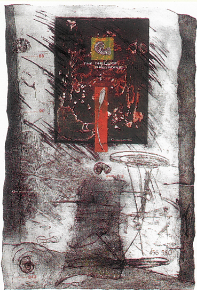
章恒欽併用版作品 Evolution III 80×56 cm