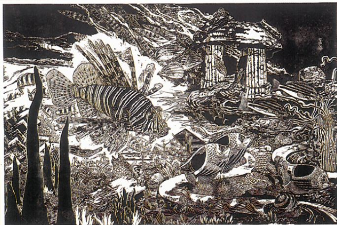
李景龍橡膠版作品「水族物語—陸沈篇 I」 90×60 cm