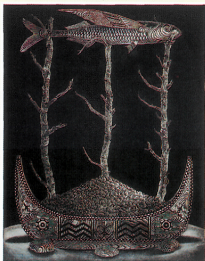
羅平和美柔汀銅版畫作品 祭 65×495 cm