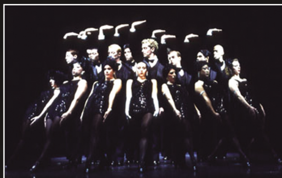
百老匯秀FOSSE劇照